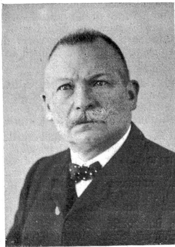
† Oberst Franz Siegwart.

Die Anfänge seiner Tätigkeit bei der eidgenössischen Finanzkontrolle reichen in jene Zeit zurück, da noch Gaslampen die wenig zahl-