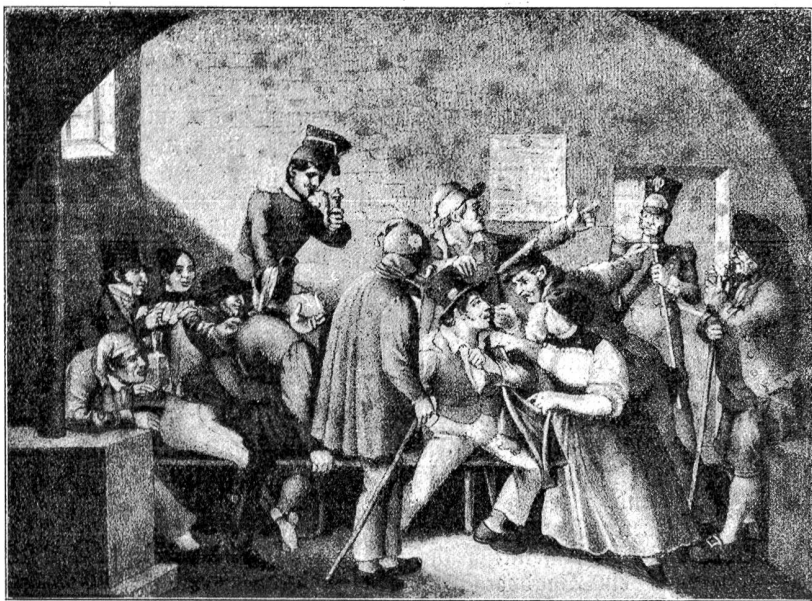
Kellerwirtschaft. Nach einer Zeichnung von H. v. Arx (1802—1858), Ex. des Klötzlikeller.

Das änderte den Entschluß. Noch einmal sprangen sie in die Schlitten — eine Viertelstunde später waren sie auf gebahntem Weg, um gegen acht Uhr in Island Harbor zu halten.