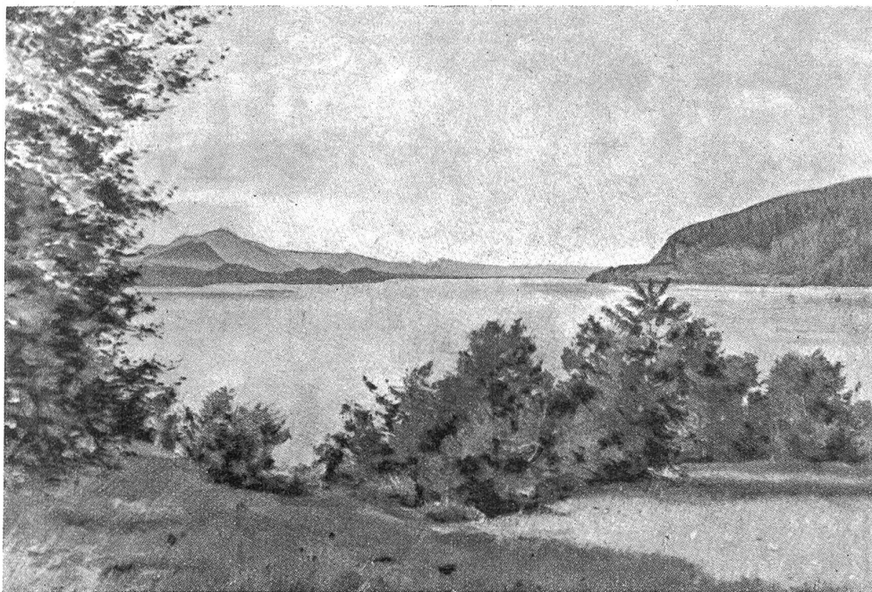
Marcus Jacobi. Ansichtspostkarte bestimmt für die diesjährige Pro Juventute-Aktion. (Die in letzter Nummer reproduzierte Pro Juventute-Glückwunschkarte wurde in einem Teil der Auflage irrtümlich mit M. Jacobi signiert.)