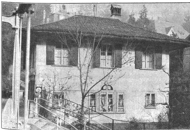
Das alte Zollhaus bei der Altenberg-Hängebrücke.

Bekanntlich sind seit 1850 die Brückenzölle aufgehoben. In dem alten, grauen Haus jenseits der Hängebrücke war seit Jahrzehnten ein „Chrämerladen“ eingerichtet. Unbeachtet des großen Publikums erfüllte es bis zum Abbruch seinen Dienst. Ueber 100 Jahre hat es allen Stürmen getrotzt, um dann innert zwei Tagen abgebrochen zu werden. Architekt G. Romang, Bern, hat nun an dessen Stelle ein größeres Mehrfamilienhaus mit Ladengeschäften und Garagen erstellt. Das Bauwerk ist dieser Tage aufgerichtet worden. Daß trotz den vielen Leerwohnungen in Bern diese Neubauten schon heute gänzlich vermietet sind, beweist, daß sonnige, gute Lagen in Stadtnähe immer ihre Abnehmer finden. —ll—