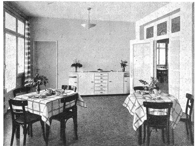
Marie Sollberger-Haus in Herzogenbuchsee: Zum Frühstück bereit

didien, buschigen Schweif, auf den jeder Fuchs mit Recht stolz gewesen wäre. Er hob seinen scharfgeschnittenen Kopf aus dem Ginsterbüsch empor und blieb auf seinem hügelabwärts wachsam und vorsichtig stehen, um über das