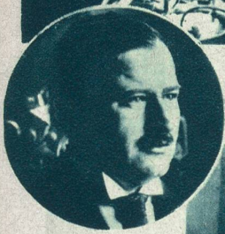
Der gestürzte französische Ministerpräsident Daladier, Kriegsminister im neuen Kabinett Sarraut.