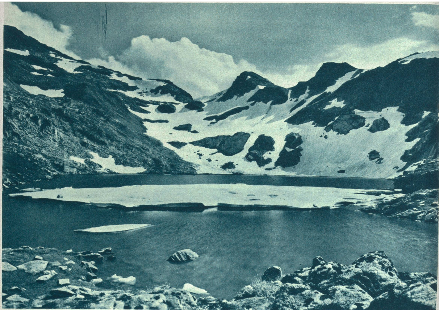
Blausee ob Berisal (Simplon).