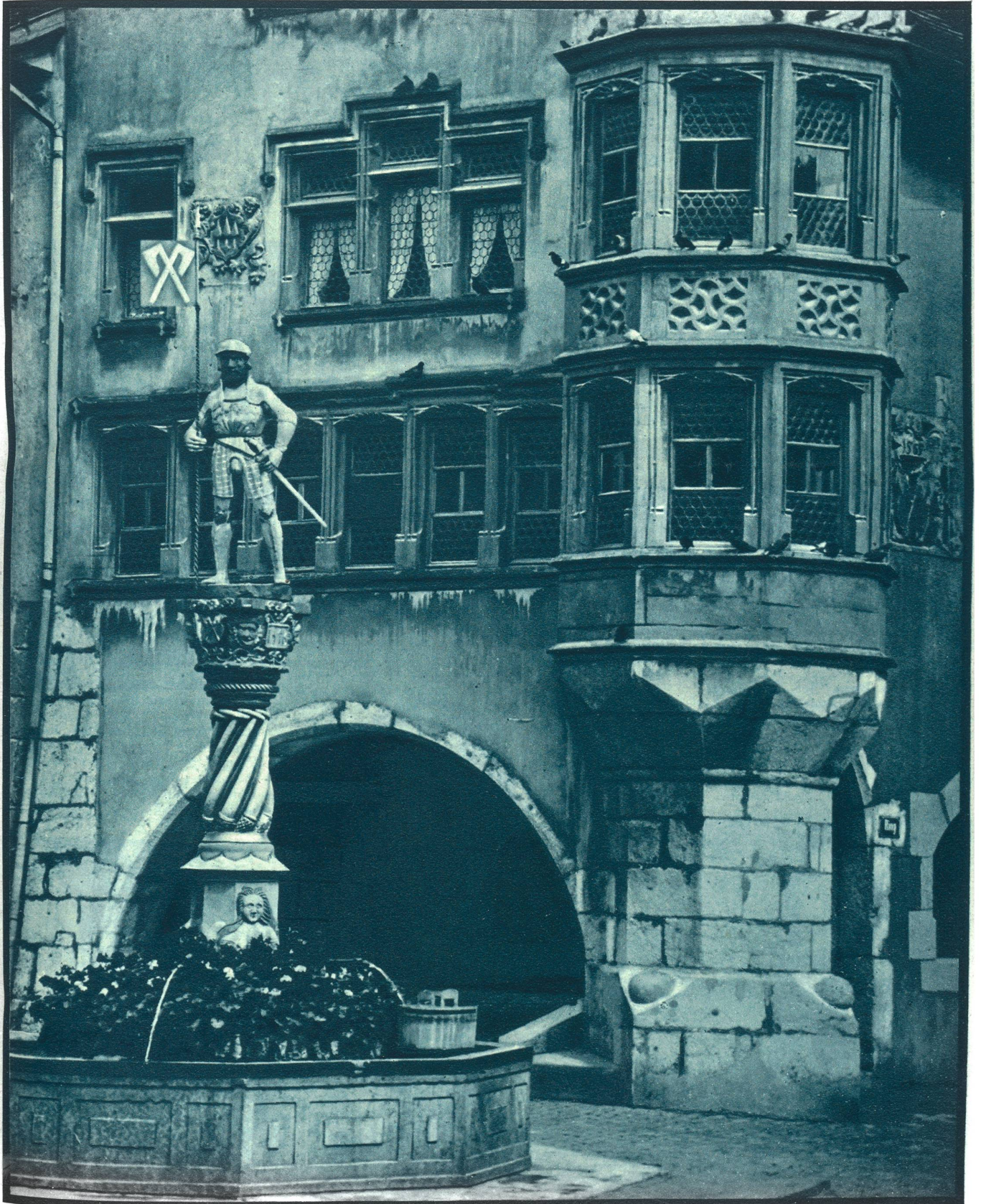
Der Venner Gäuffi-Brunnen vor dem Zunfthaus in Biel.