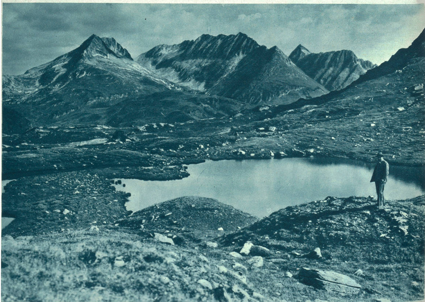
Der von der Station Oberalpsee der Furka-Oberalp-Bahn aus erreichbare Maigels-See.