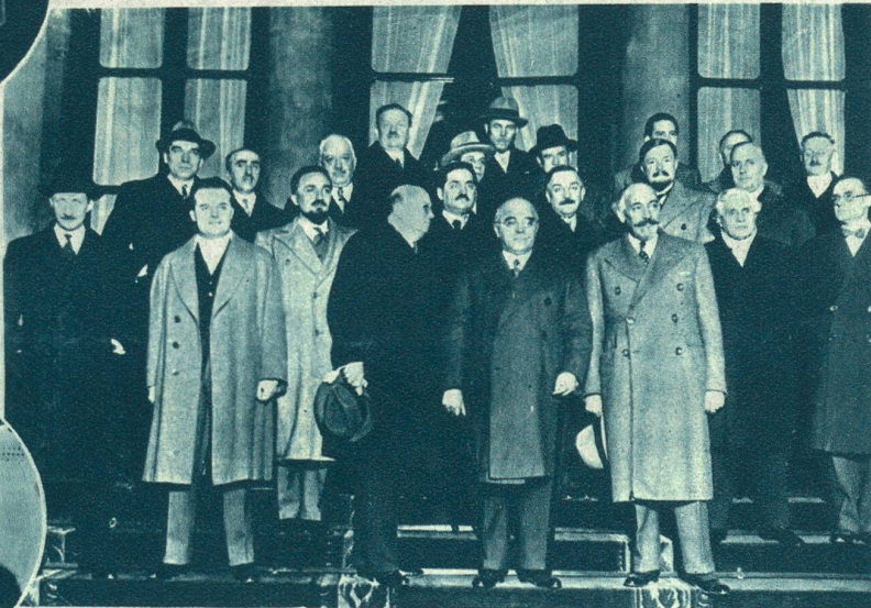
Das neue französische Kabinett. Der frühere Marineminister Sarraut hat die neue französische Regierung gebildet. Ihr gehören 14 Minister des alten Kabinetts Daladier an.