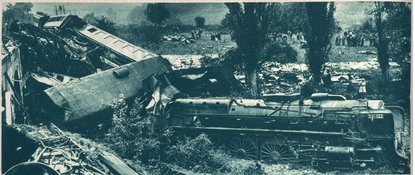
Von der Eisenbahnkatastrophe des Expreszuges Cherbourg—Paris bei Evreux. — Unser Bild zeigt die Gesamtansicht der Unglücksstelle.