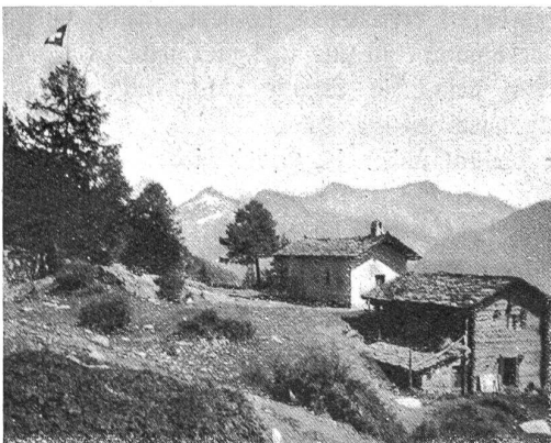
Alp Raft (Ausserberg).

In den nachfolgenden Zeilen soll nun zuerst ein Bild über das Werden und den heutigen Aufbau der Studentenaktion gegeben werden, und in einem zweiten Abschnitt ist die Aufgabe des Arbeitsdienstes für die Arbeitslosen skizziert. Steht bei den studentischen Arbeiten das geschaffene Werk als Hilfe für unsere Gebirgsbevölkerung im Vorder-