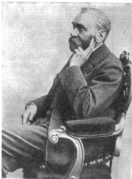
Porträt Nobels aus dem Jahre 1896.

Das alles trifft auf den Mann zu, den die Natur zum Dichter, Denker, Grübler und Vorkämpfer der wichtigsten