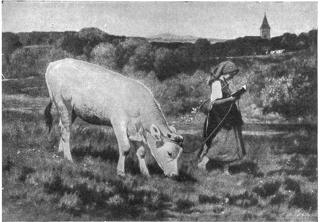
R. Koller: Herbst-Idyll.

Daß es wahr bleiben würde, dessen fühlte sie sich so