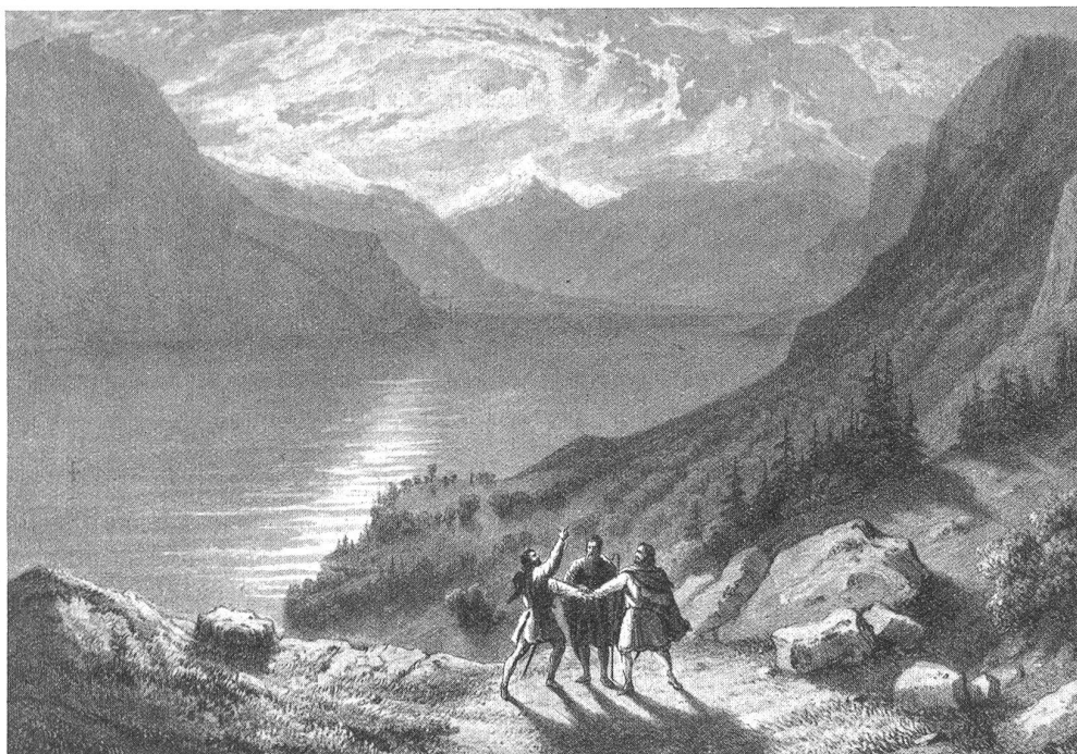
Der Dreimännerschwur auf dem Rütli. — Nach einem alten Stich.