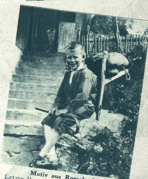
Motiv aus Rorschach. Letzte Rast beim Holen des täglichen Brotes.