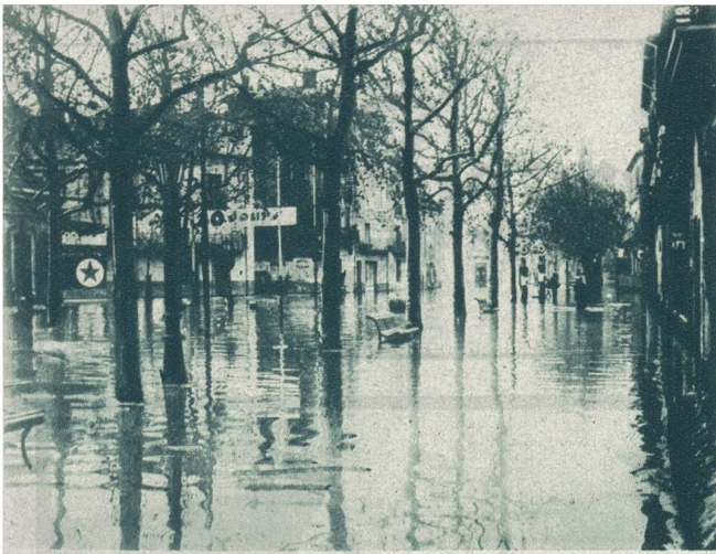
Erstes Bild von den Ueberschwemmungen in Südfrankreich. Die Hauptstraße der Stadt Béziers, die am schwersten mitgenommen wurde.