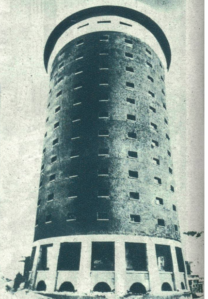
Das seltsamste Hotel der Welt wurde kürzlich auf dem Berg Sestri in Oberitalien erstellt. Es ist hauptsächlich für Wintersportler bestimmt.