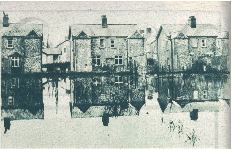
Ueberschwemmungen in Belfast (Irland), bis zu einer Höhe von 1½ m.