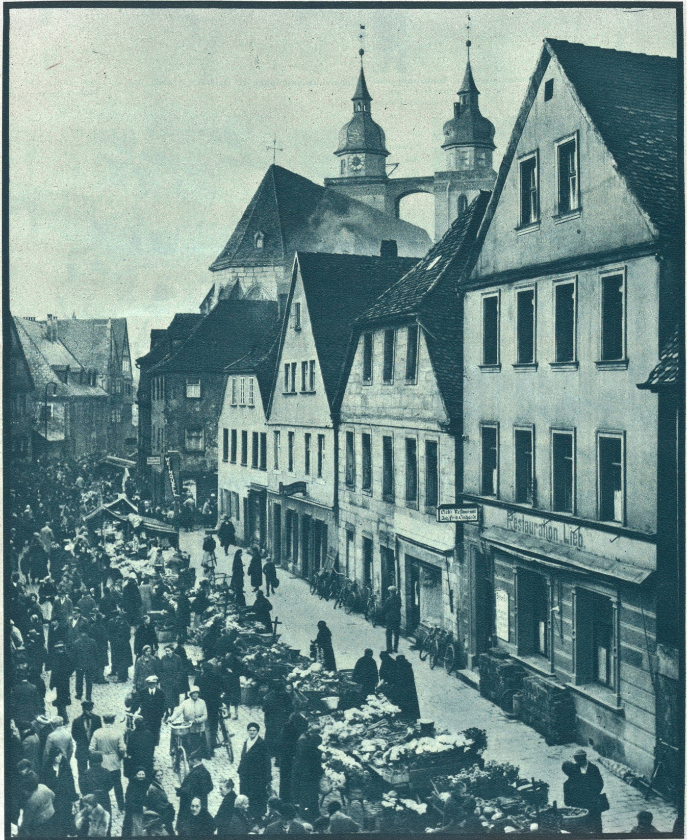
Das alte Bayreuth,