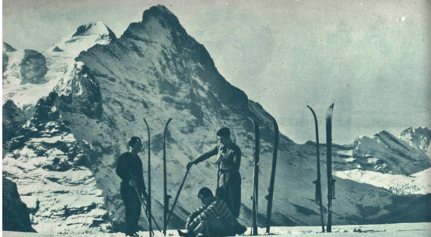
Der Eiger ob Grindelwald.