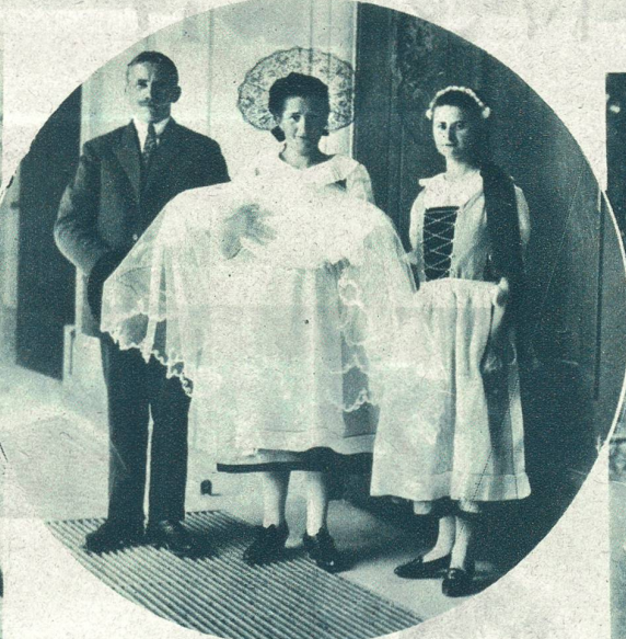
Eine Taufe in der Landestracht (Sarganserländer, Kt. St. Gallen).