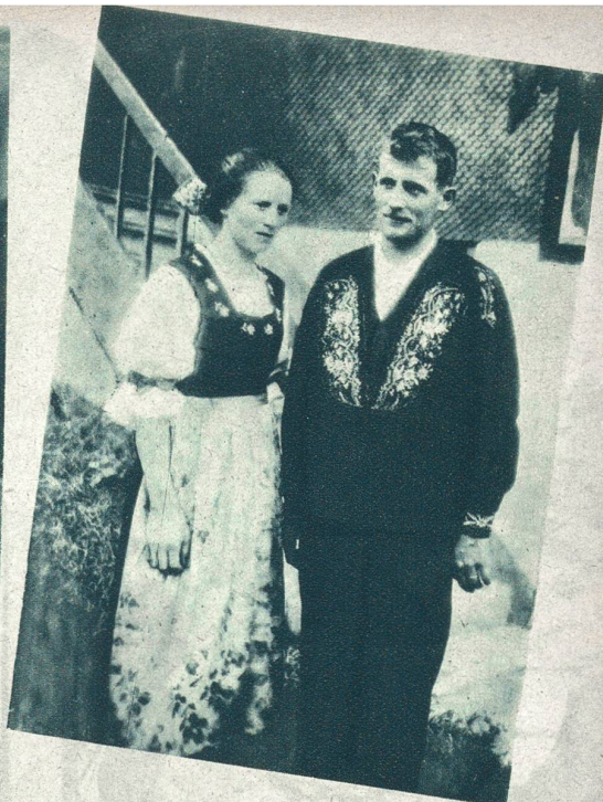
Fürstenländerin aus Wil.