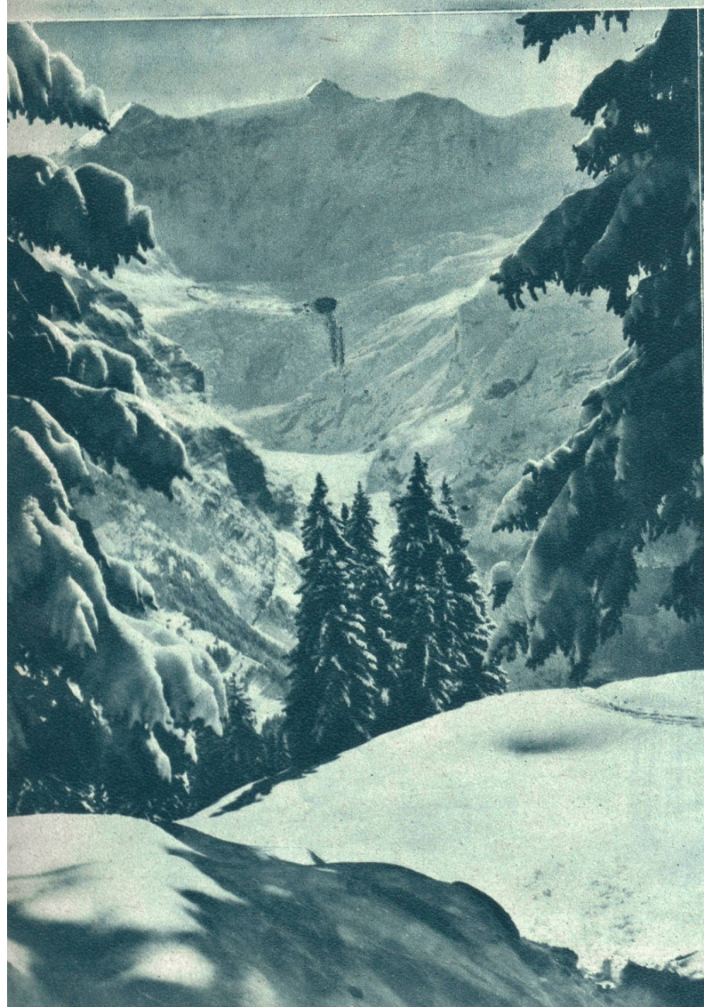
Unten rechts: Bei Adelboden im Gilbach.