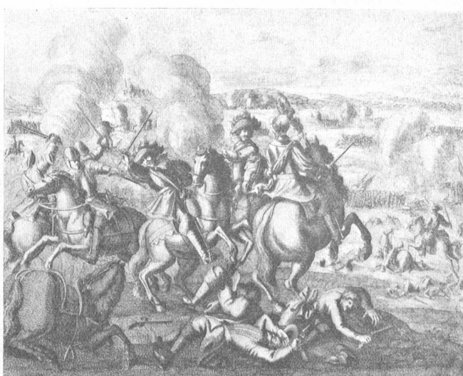
König Gustav Adolfs, des Königs von Schweden bei Lützen 1632.