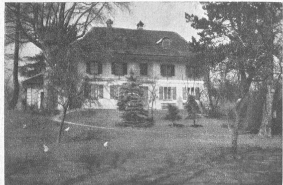
Der „Stod“ in Leuzigen.

bezahlen; Reisenden, die sich eine Krankheit zugezogen hatten, gewährte man Obdach und Pflege, bis sie sich zum Weitermarsch stark genug fühlten. Er lag einer seinem Siech-