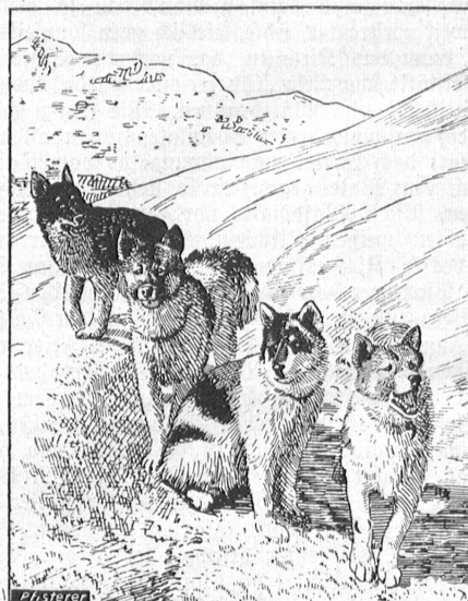
Polarhunde der Jungfraubahn.

Nach dem Morgenimbis bringt uns des Teleskop auf der Aussichtsterrasse manche interessante Einzelheit aus dem weiten weißen Reich nahe, und angehende Segelflieger können hier die Flugkünste der zahlreichen Alpendohlen studieren. Durch den 240 Meter langen Sphinxstollen gelangen wir neuerdings ins Freie; vor seinem an eine Eiscrotte erinnernden Ausgang erwartet uns eine Überraschung: Polar-