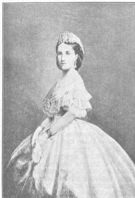
Kaiserin Charlotte von Mexiko.

heute in Schanghai) die Interessen der Fremden gegen die Gefahren der chaotischen Zustände im Lande zu schützen, da ahnte bereits das französische Volk und mit ihm die