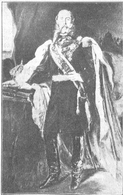
Kaiser Maximilian von Mexiko.

Als sich in der Konvention von London am 31. Oktober 1861 der religiöse Eifer der Königin Isabella von Spanien, die Neigung des französischen Kaisers, Napoleon III., für hochfliegende Pläne und der fanatische Ehr-