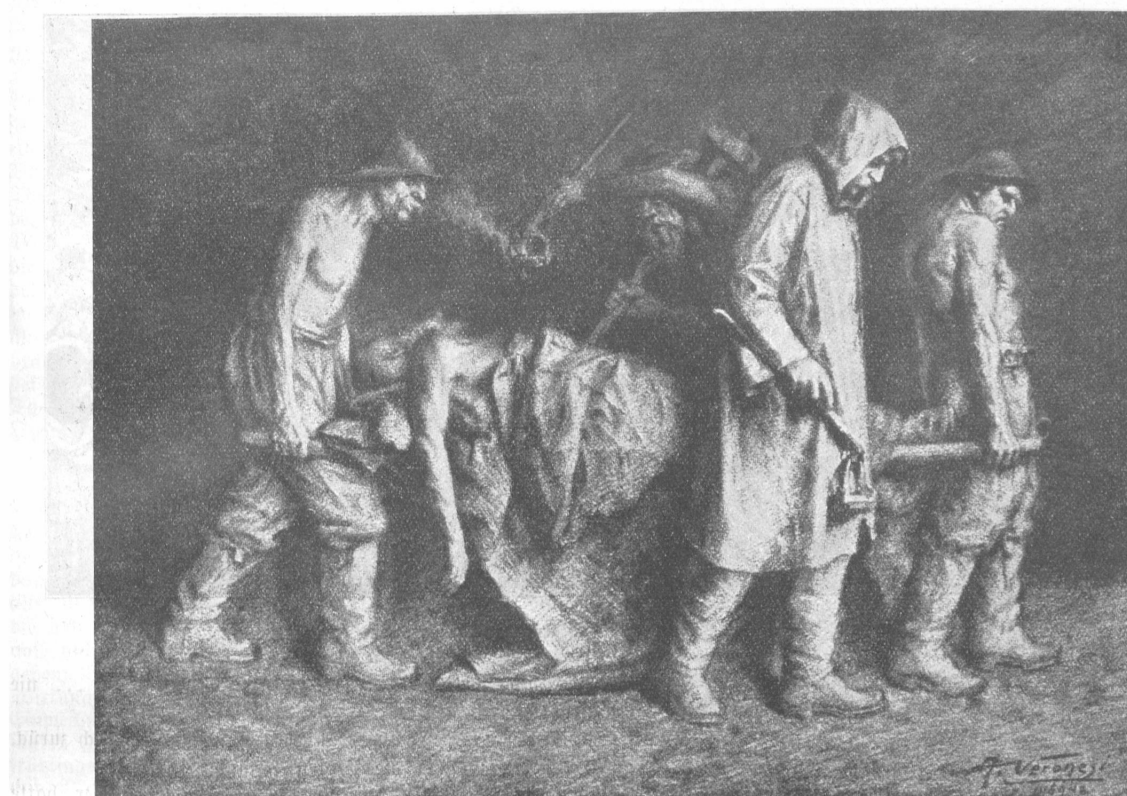
Vincenzo Vela. Opfer der Arbeit. (Denkmal in Alrolo zur Erinnerung an den Bau der Gotthardbahn.)

auch seine alte Blutleere im Gehirne nicht befiel, so schien doch in den Assoziationszentren der Hirnrinde eine Störung der Gehörseindrücke vorzuliegen.