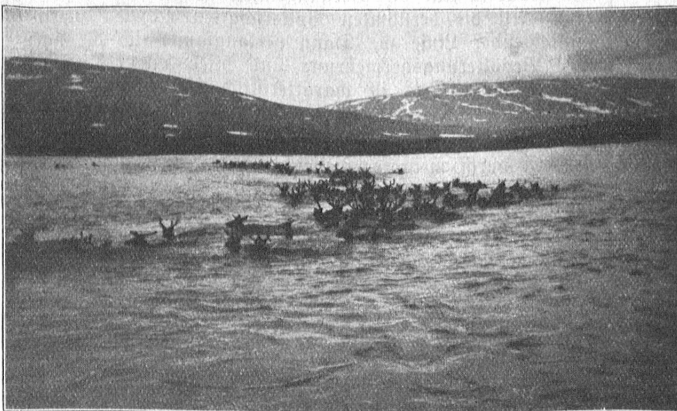
Schweden. Die Lappen und ihre Heimat. Eine schwimmende Renttierherde.

Er setzt sich lieber den vielfachen Gefahren der hier dem Lappen an Mißtrauen nicht nachstehenden Natur aus, mit ihren Lawinen, Stürmen und Grauhunden, den Wölfen, als daß er sich mit den