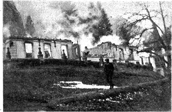
Das Heustrichbad nach dem Brand.