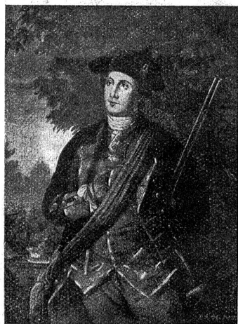
George Washington, der erste Präsident der Vereinigten Staaten.

Scharfsinn und seine Festigkeit auszeichnete. Als der Krieg gegen England ausbrach, wurde er in den Kongreß abgeordnet. Dieser berief ihn am 14. Juni 1775 zum Ober-