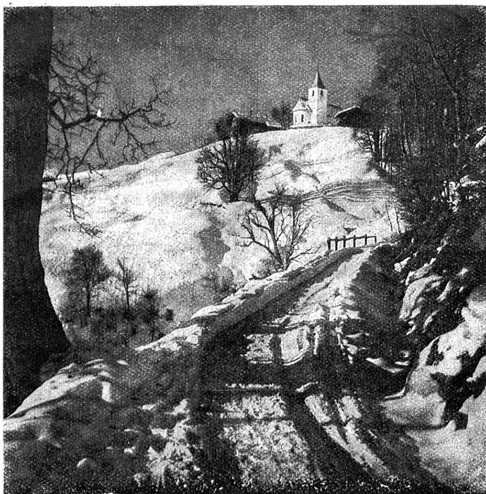
Winter im Prättigau.

Stengeln stand, so schien ihr das eigene Sein. Am besten wäre es, klagte sie, sie hauten mich ab in den wurmigen Wurzel!