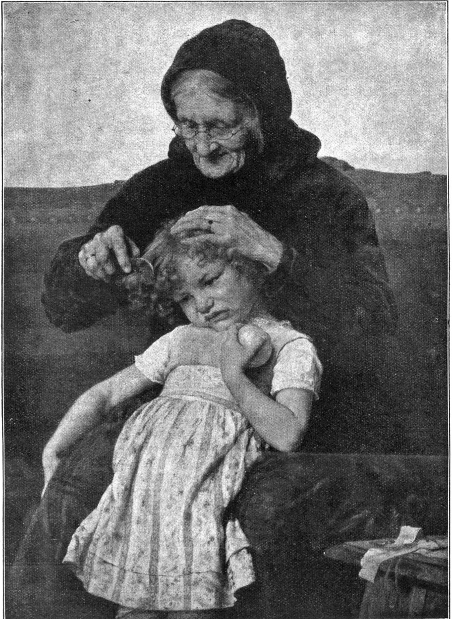
Großmutter's Liebling. Von G. Jakobides.

Die Wirtin gab es auf, ihre Schützlinge reinwaschen zu wollen; sie merkte, daß sie mit Bauern zu tun hatte, die von einer neumodischen Auslegung der Ehegemeinschaft