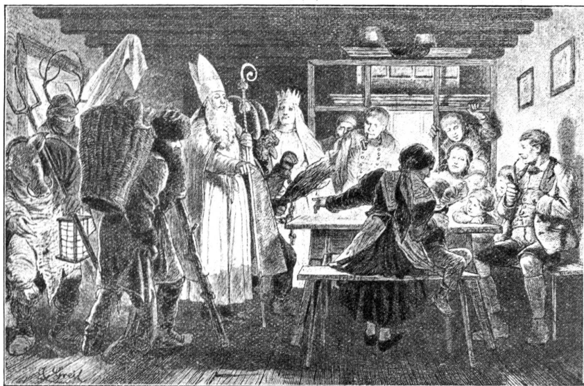
St. Nikolaus in Windischgarten.

nichts, auch jener Bauer ging hinaus, „da packte ihn der Wolf und fraß ihn auf — nur die Stiefel blieben übrig.“