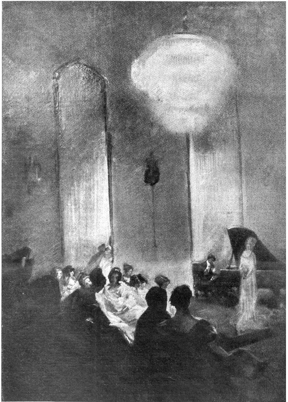
Konzert. Von Schlageter.

Das Weibervolk ist sehr wunderlich, denkt er bei sich.