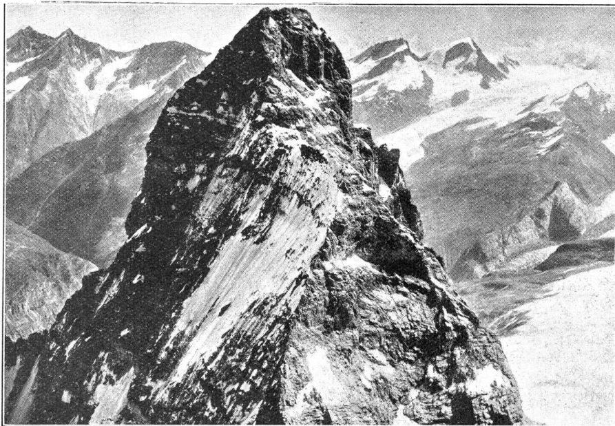
Matterhornspitze, Rimpfisch und Strahlhorn, Gornergrat (von Südwesten, aus 4400 Meter Höhe).

Wir haben allen Grund, den Luftbeförderungsmaschinen die vollste Aufmerksamkeit zu schenken, weil wir dank unserer verkehrsgünstigen Lage einen Großteil des europäischen Luftverkehrs über unser Gebiet führen können. Wir sollen aber auch der weiteren Ausbreitung des Flugwesens fördernd gegenüberstehen, denn während die Eisenbahn, an der Erde klebend, erst das Bahnen der Wege erfordert, der Brief auf