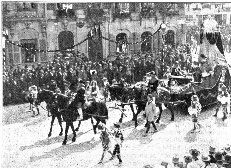
Historischer Festzug an der Gründungsfeier der Stadt Bern 1891. Bernische Kunst, Wissenschaft und Geschichte. Dieser Wagen fand damals von allen Seiten die grösste Anerkennung.