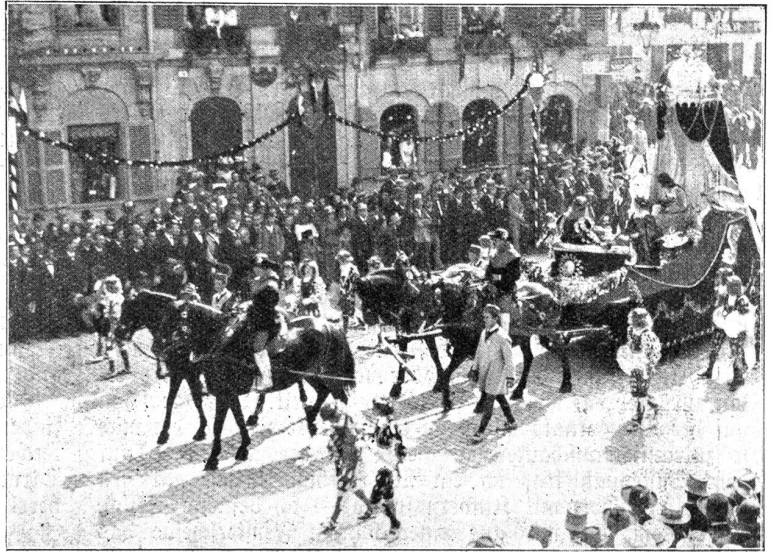
Historischer Festzug an der Gründungsfeier der Stadt Bern 1891. Bernische Kunst, Wissenschaft und Geschichte. Dieser Wagen fand damals von allen Seiten die grösste Anerkennung.