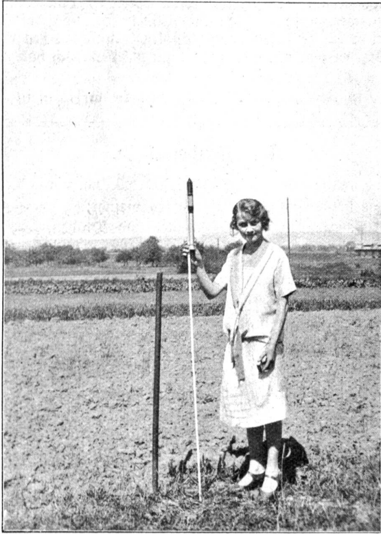
Die zum Abbrennen aufgemachte Rakete.

kam Stieger zu einer gewissen Berühmtheit. Das Hagelgeschütz erlebte dann eine ganze Reihe Verbesserungen (Hintertlader, Ladung durch Patrone, Handabzug, Abzug durch