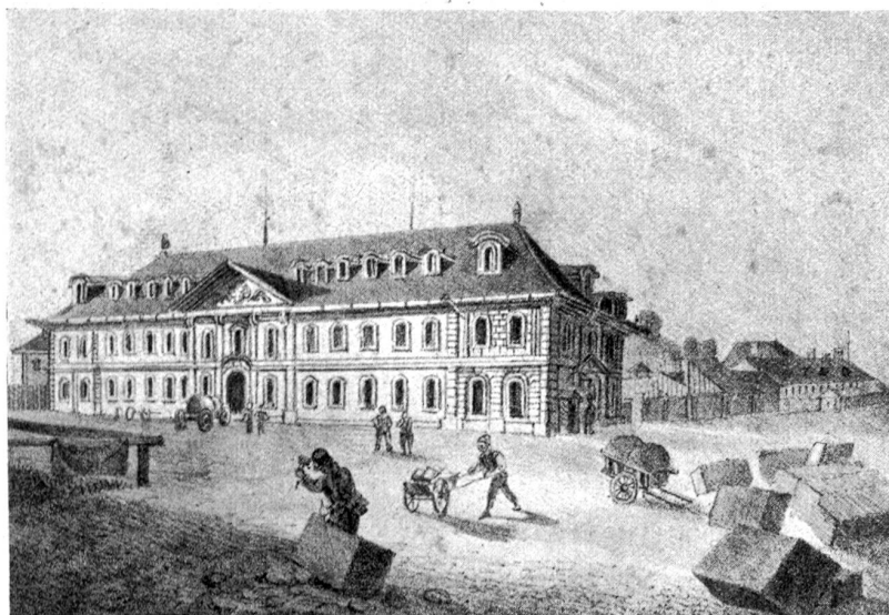
Der ehemalige Artillerieschopf (Kavalleriekaserne) als Kaufhaus (Douane) um 1840. (Schweiz. Landesbibliothek)