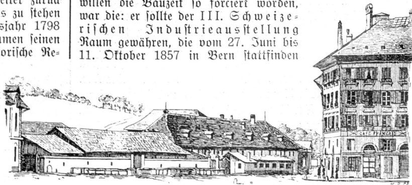
Das alte Schellenwerk und die Kavalleriestallungen 1856. Aus „Bern, Bilder aus Vergangenheit und Gegenwart“ (1896).

Die erste Zweckbestimmung des Neubaus, um deren willen die Bauzeit so forciert worden, war die: er sollte der III. Schweizerischen Industrieausstellung Raum gewähren, die vom 27. Juni bis 11. Oktober 1857 in Bern stattfinden