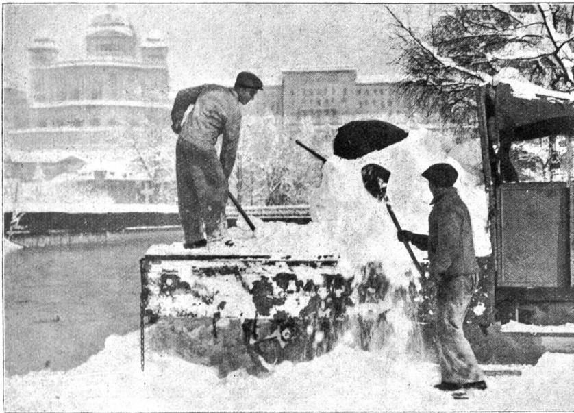
Der grosse Schneefall in Bern. Der weggeräumte Schnee kommt in die Aare.

sondern auch des seelischen Zustandes erklärbar. Es genügt eine fortgeschrittene Nervenschwäche, um uns schwer krank erscheinen zu lassen.