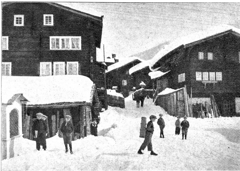
Dorfasse in Münster (Oberwallis).

Die Frage greift mitten hinein in ein Problem, das seit Weltbeginn besteht, gegenwärtig aber, zur Zeit dieser gewaltigen, wirtschaftlichen Krise eine akute Form angenommen hat. Um sie richtig zu beantworten, müssen wir uns vorerst mit dem Wesen des Kindes etwas beschäftigen. Das Kind ist wie eine kleine aufbrechende Blume, es braucht Licht, Sonne und Schutz zu seinem Gedeihen. Sein Gemüt ist weich wie Wachs, alle Eindrücke prägen sich tief ein, traurige ganz besonders. Wir alle haben schon verschüchterte, arme Kinder gesehen, die fast nur auf Härte, Rohheit und Grobheit in ihrer Umgebung eingestellt waren und unter freundlichen Worten nur langsam auftauten. Entweder leidet