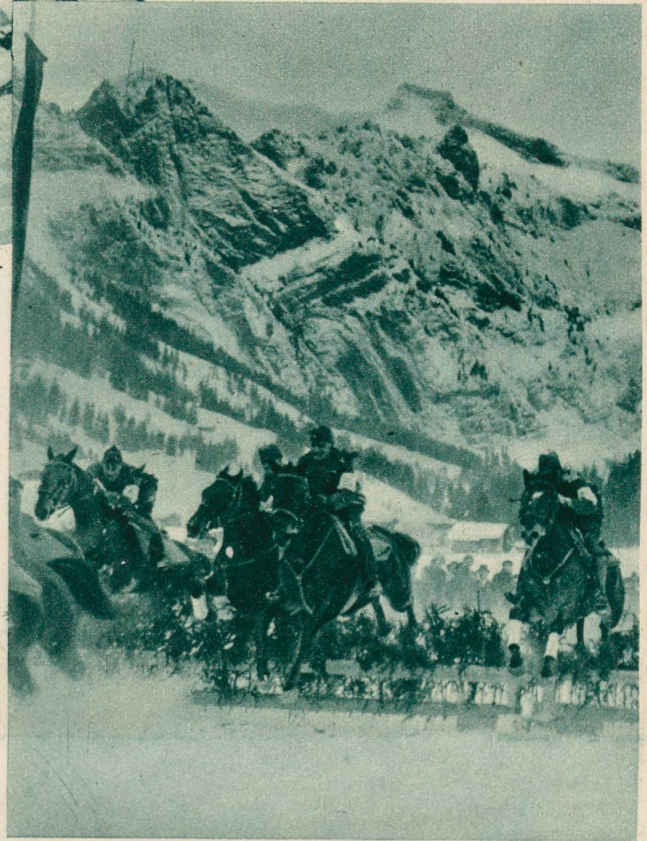
Militär-Hürdenrennen in Adelboden.

Von links nach rechts: Sitzend: die Italienerin, die Esthin, die Belgierin, die Französin, die Ungarin, die Engländerin, die Dänin. Stehend: die Jugoslawin, die Oesterreicherin, die Rumänin, die Deutsche, die Türkin, die Griechin, die Holländerin, die Spanierin.