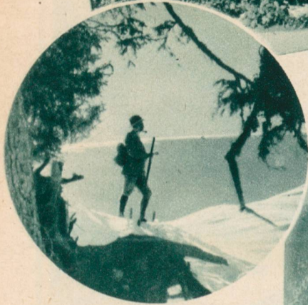
Winter im Pays d'Enhaut.