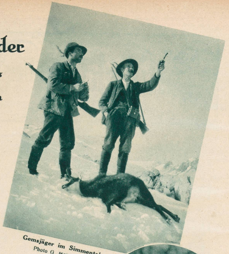
Gemsjäger im Simmental.