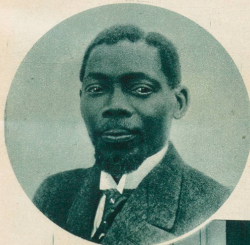
Monsieur Diagne , der erste farbige Unterstaatssekretär in einem französischen Ministerium.

Diese kleinen Skifahrer standen schon letztes Jahr in Adelboden zum Start bereit. Sie werden gewiß alle wieder erscheinen zum 25. Schweizerischen Skirennen , welches dieses Jahr als Jubiläumsrennen am 28. Febr. und 1. März in Adelboden stattfindet.