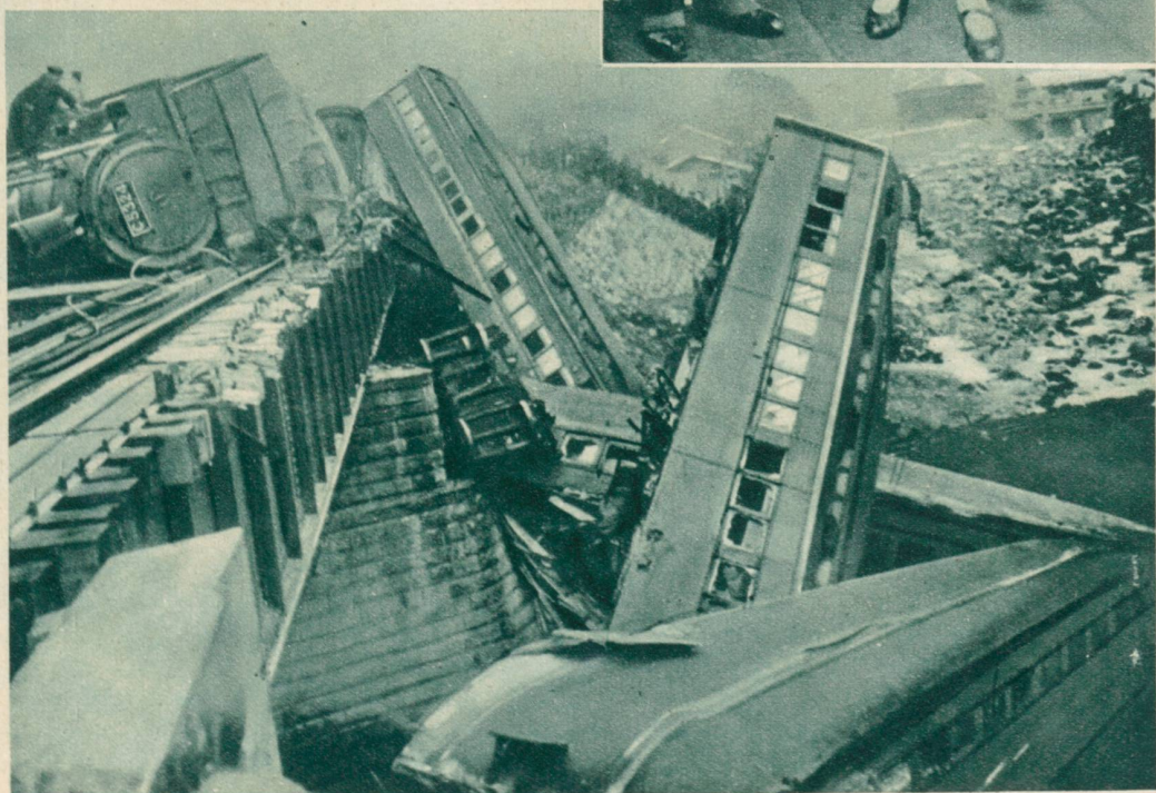
Unten rechts: In Japan stürzte ein Personen- zug über eine Brücke hinab. 50 Tote, 80 Verwundete.