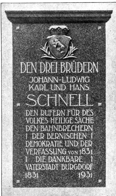
Die Schnell-Gedenktafel in Burgdorf.

und seine Berner Aristokraten aufforderte, dem Volke mehr Rechte zu gewähren, indem er in den Staatsromanen festnagelte: „Tugenden und Fähigkeiten sind an keine Ahnen gebunden!“ Weil man nicht auf ihn hörte, erhob sich das Volk 1798 gegen seine Regenten.