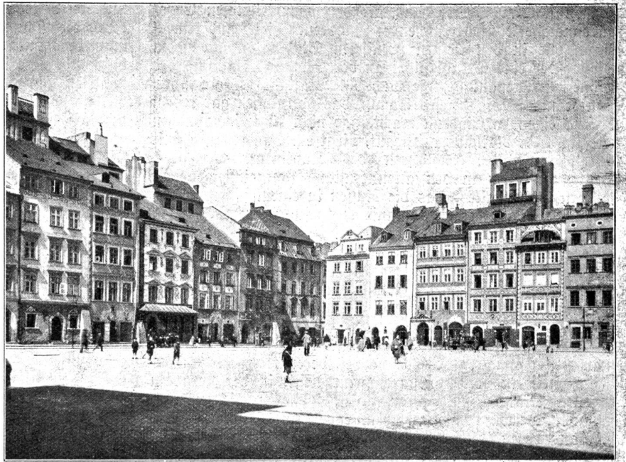
Warschau: Alter Ring. Alle Häuser sind rekonstruiert und von ersten Künstlern unter Wahrung der Tradition neu bemalt.

Wer München sagt, denkt an Bier, Museen und Gebirge, an Lederhosen und Genagelte, Dirndl, Schnadahüpfl, Ländler, Schwabing, Künstlerbrutstätten, Fasching, Redouten, Bal parés.