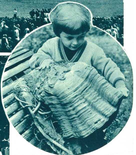
Riesen-Pappelpilz (Polyphor) an der Pilzausstellung in Paris.

Der Polyphor ist ein Schmarotzerpilz, der sich von den Säften der Pappel nährt. Die Bäume, an denen er sich ansetzt, gehen zugrunde.