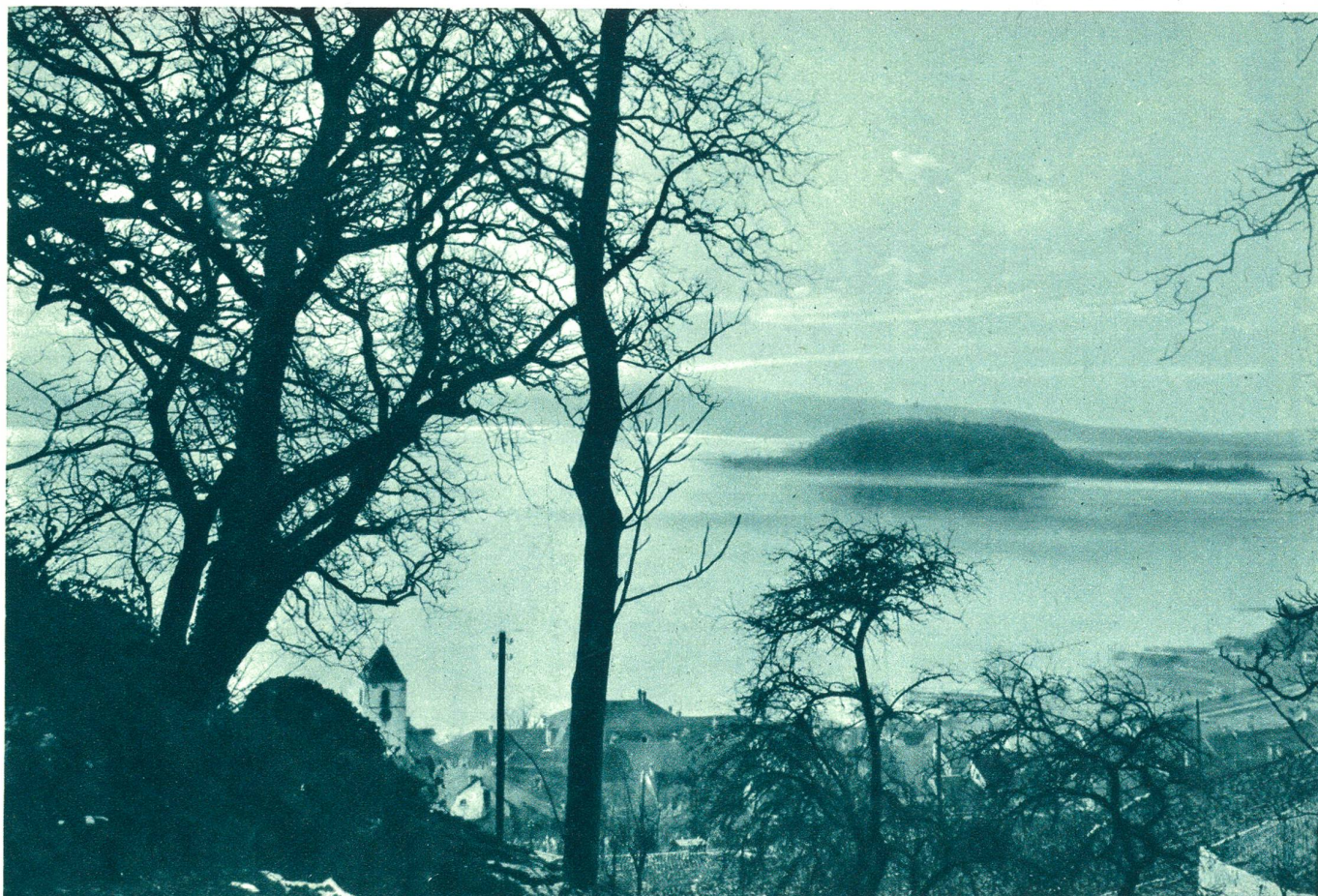
Peters-Insel im Bielersee.