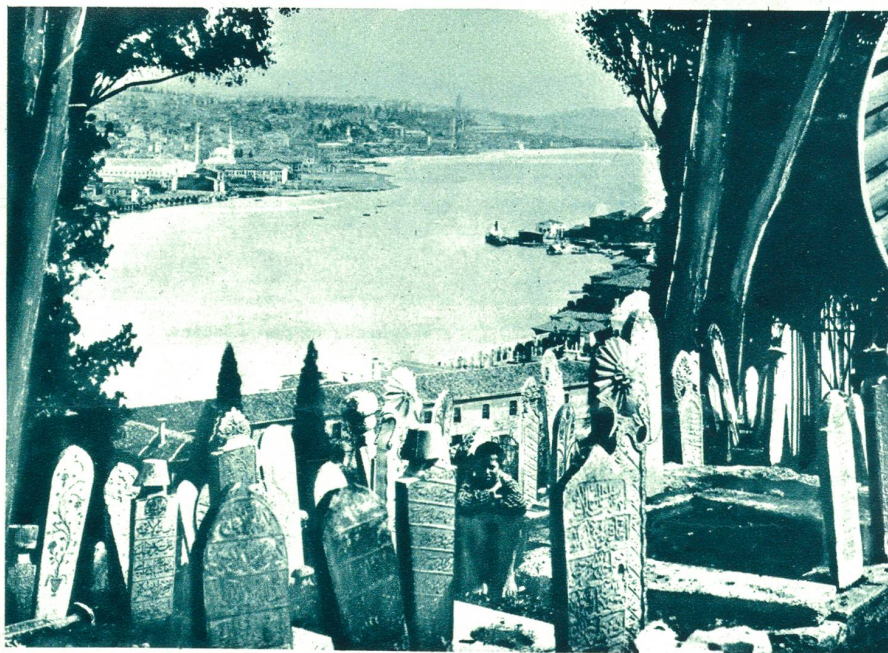
Türkischer Friedhof in Konstantinopel.

Der Polyphor ist ein Schmarotzerpilz, der sich von den Säften der Pappel nährt. Die Bäume, an denen er sich ansetzt, gehen zugrunde.