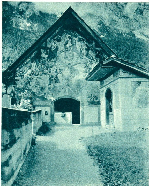
Links: Beinhaus auf dem Friedhof S. Gion, Ems.

Rechts: Grabschmuck auf dem Dorf- friedhof (der Kranz auf dem Grabe von Nationalrat Felix Koch, Tamins, wurde kürzlich dort nieder- gelegt vom Ver- band schweize- rischer Post- halter, dessen Gründer Nat.-Rat Koch war).