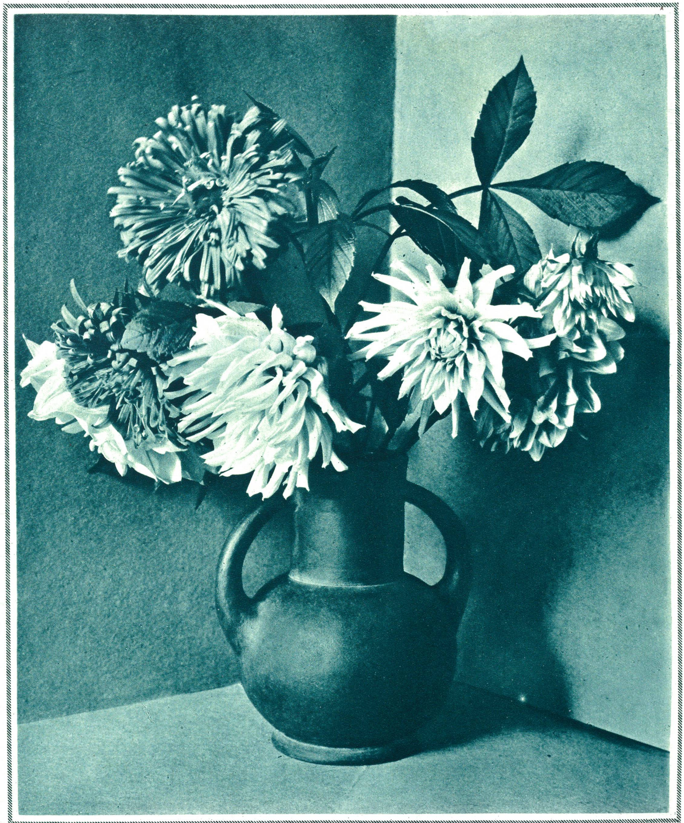
Astern und Dahlien, der Blumenschmuck des Spätherbstes.