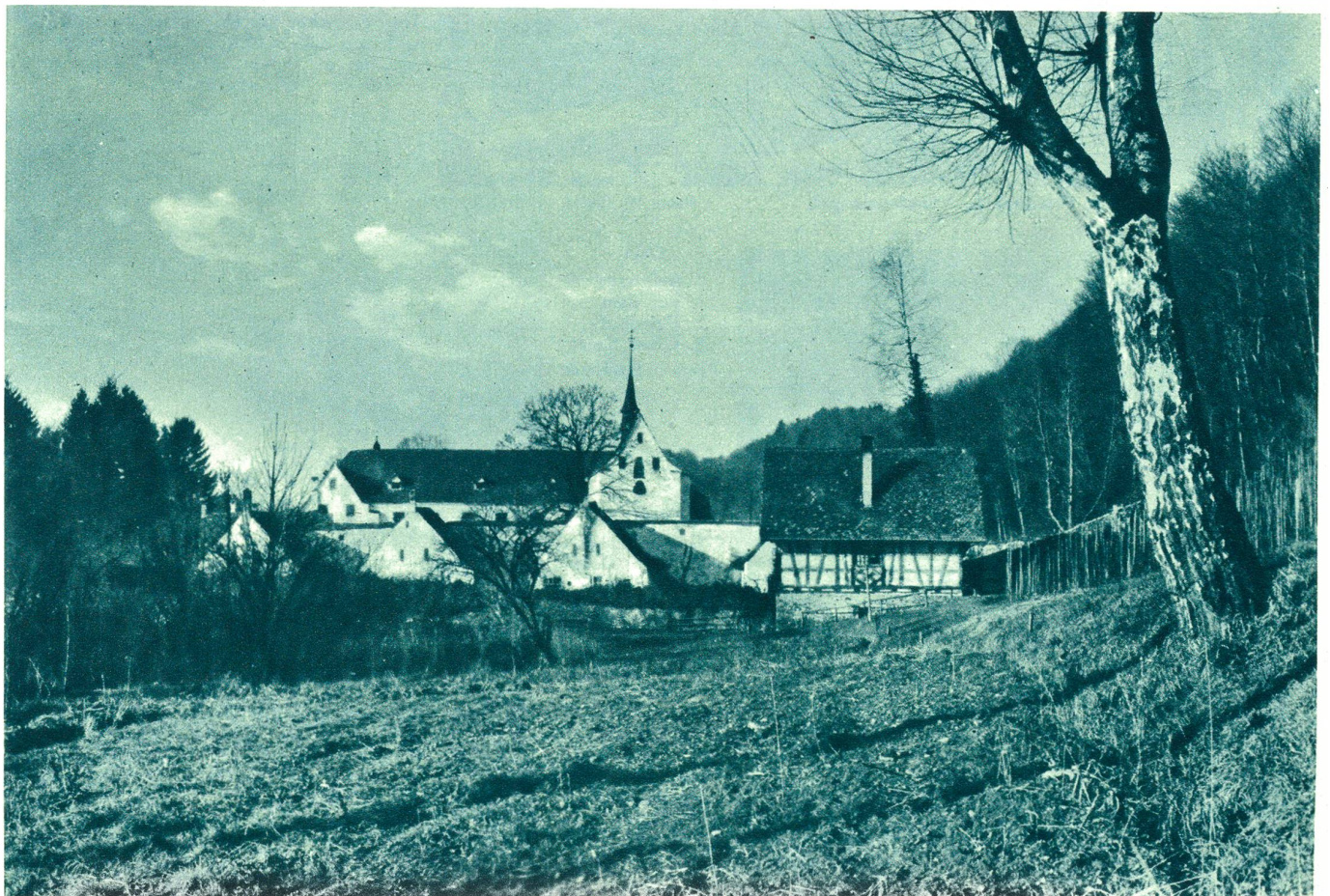
Die ehemalige Kartause Ittingen (Thurgau).