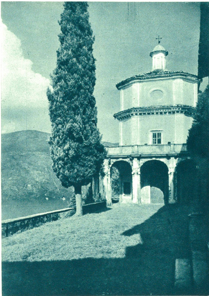
Morcote am Luganersee.