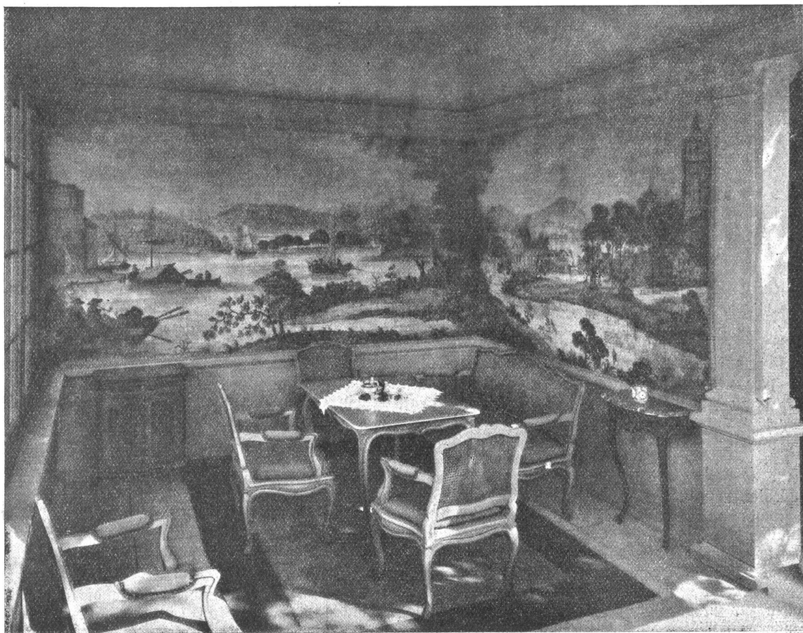
Blick in den Gartenpavillon eines Berner Landhauses. — Entwurf und Ausführung durch Th. Schärer's Sohn & Cie., Bern.

ferne Ränel und Ablaufrohre und ein Schiebefenster in dunkler Natur-eiche vereinigen sich mit dem Grau des Steins und dem satten Braun der Ziegel zu einem auch farbig ungemein harmonischen Bilde, das sich in heiterer Eleganz vom tiefen Grün mächtiger Baumgruppen abhebt. Das Innere des Gartenhauses, das sich loggiaartig nach der Terrasse öffnet, ist ganz besonders köstlich. Die Wände sind über niederem Sockel mit alten Landschaftsmalereien bedeckt; davor stehen ländliche und doch komfortable Möbel im Regencestil: Tisch, Kanapee und Fauteuils uni grün gestrichen, Kommode und