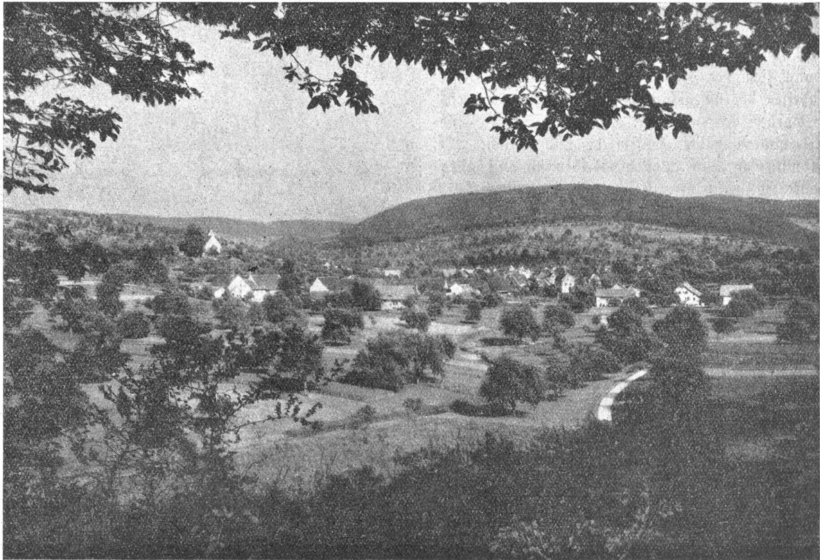
Das Dorf Magden bei Rheinfelden.