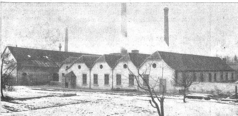
Rheinfelden. Saline Rheinfelden.

Auf der schönen steinernen Rheinbrücke, an den beidseitigen Zollposten vorbei, die eine lokale Kontrolle ausüben, kehrte ich wieder auf Schweizerboden zurück. Die Brücke bildet mit der kleinen Insel, die heute eine schmude Anlage trägt, eine hervorragend glückliche architektonische Einheit. Sie wurde 1911/1912 an Stelle der alten abgebrannten Holzbrücke von der gleichen Ingenieur- und Architekturfirma erstellt, der wir unsere neue Lorrainebrücke verdanken.