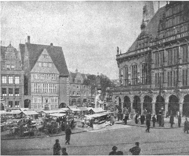
Bremen. — Marktplatz.

sehr das Eigentum ihres Mannes und Gebieters werden, daß ihre Heimat da ist, wo er sich befindet, was die Witwenverbrennung in Vorderindien mit grausamer Tragik bestätigt.