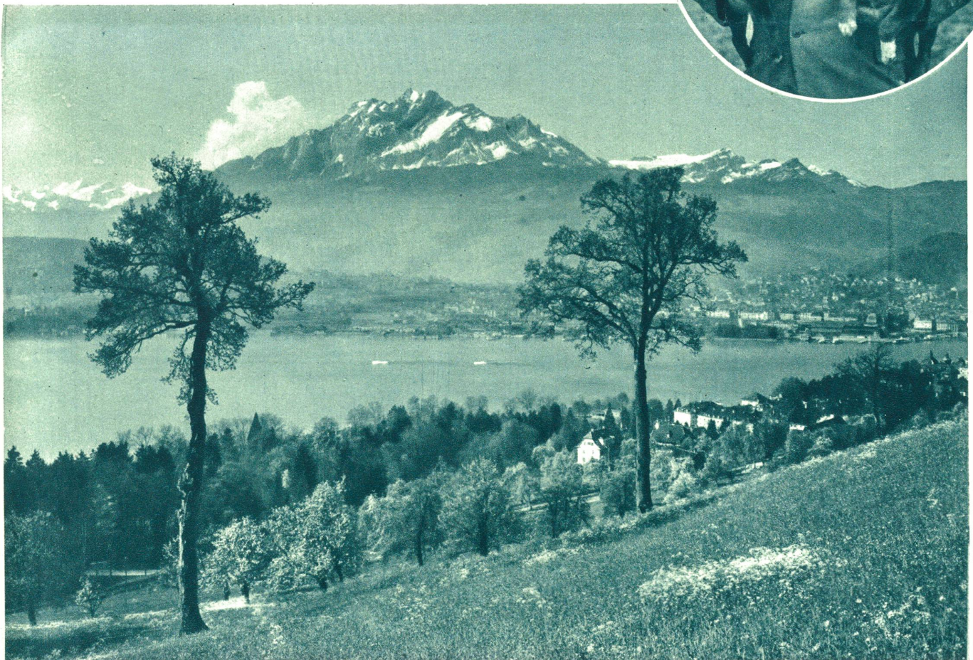
Vierwaldstättersee, im Hintergrund Luzern und Pilatus.

Rundes Bild: Die bis auf ganz wenige Tiere ausgestorbenen Entlebucher Sennen-Hunde wurden in schwierigen Zuchtversuchen rassenrein vermehrt und in Escholz matt wieder eingeführt. Der Hund ist als Treib- und Wachhund erstklassig. Gezüchtet wird er durch den Klub für Entlebucher Sennen-Hunde mit Sitz in St. Gallen.