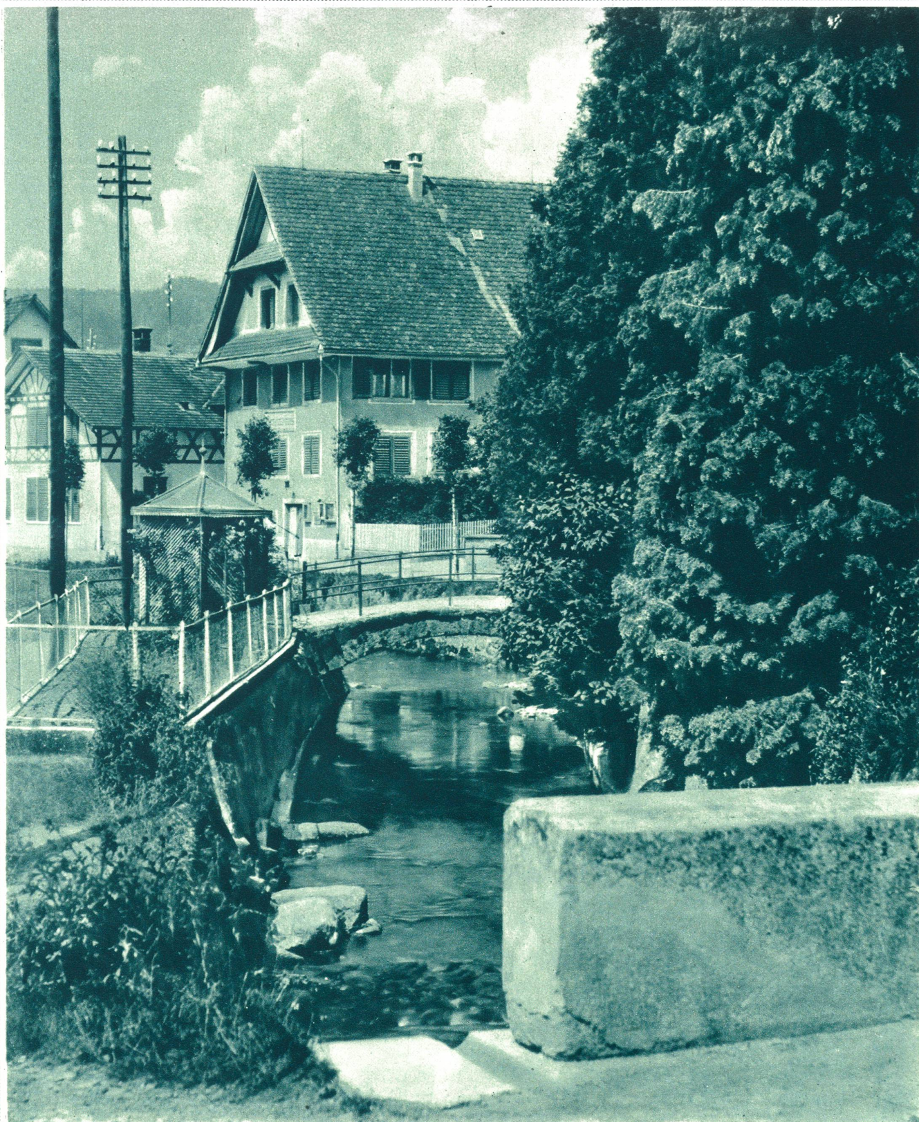
Affoltern am Albis (Kt. Zürich). Motiv am Dorfbach.