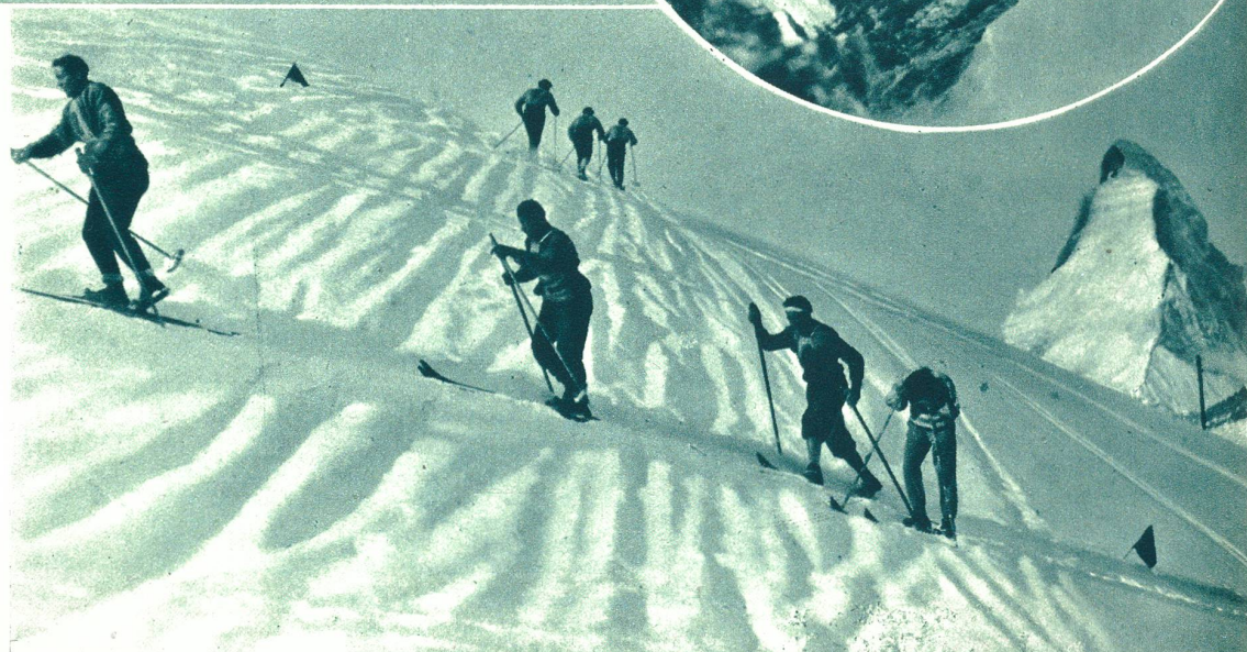
Vier Bilder aus einem großen Louis Trenker- Film, der gegenwärtig im Matterhorngebiet aufgenommen wird.