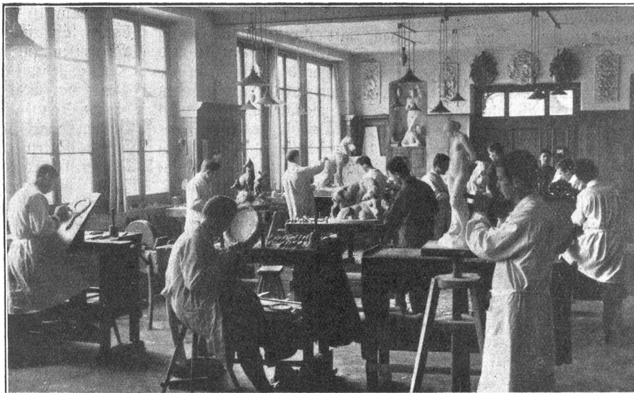
Die Schnitzerschule in Brienz.