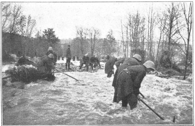
Artillerierekruten beim Reinigen des Fallbachbettes in der Nähe des Dorfes Blumenstein.