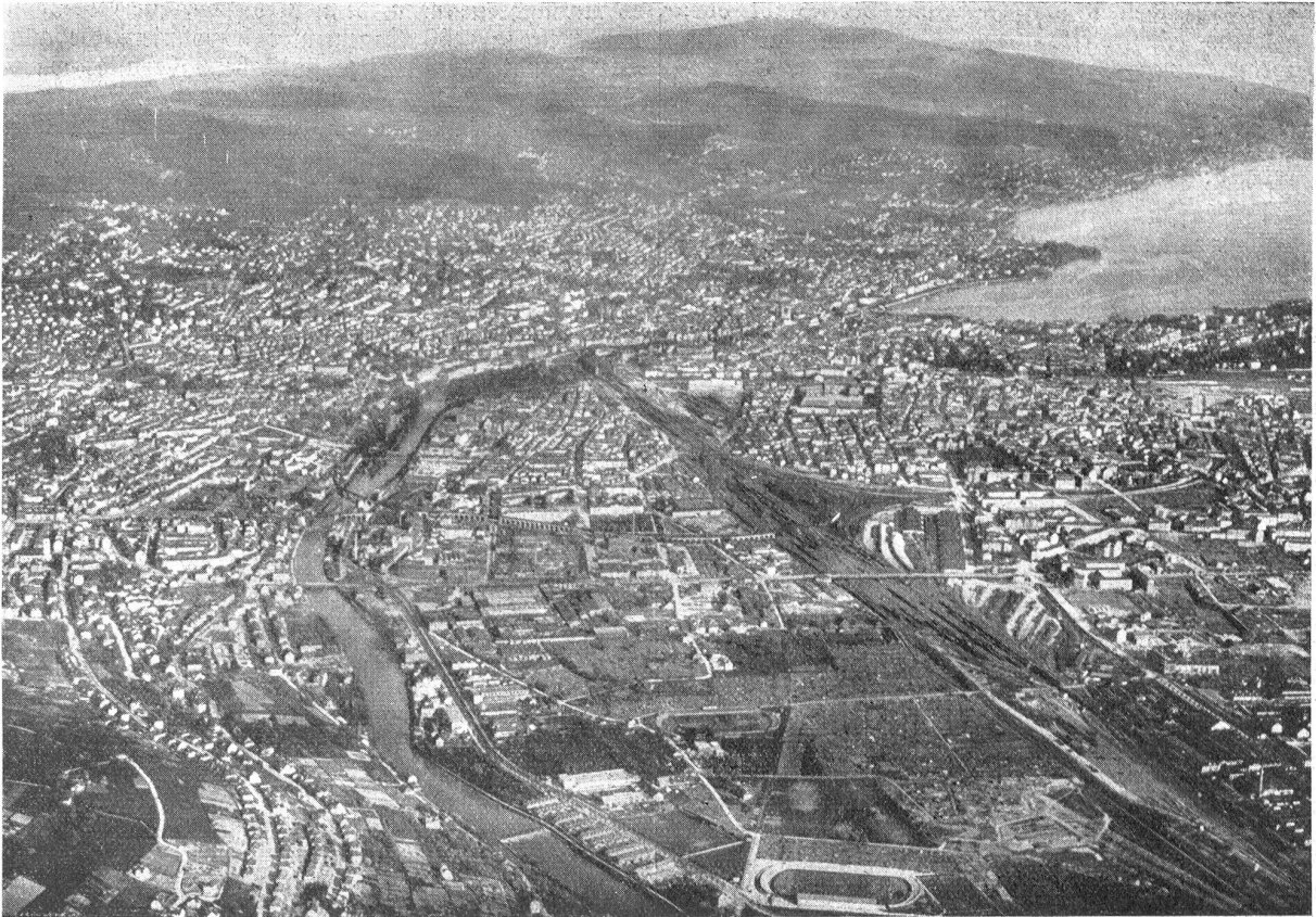
Zürich, die größte Schweizerstadt. Aufnahme der Ad Astra aus 1500 Meter Höhe. Blickrichtung Südosten.

Die Altstadt (in der Gegend des zweitürmigen Grossmünsters) verschwindet im Häusermeer der Neustadt, das ein breites Flusstal füllt, an die Abhänge des Zürichberges hinaufbrandet und auf beiden Seeufern verehbt. In der Talmitte, hart an der Altstadt, münden die Bahnlinien in einen Kopfbahnhof. Die ausgedehnten Eisenbahnanlagen verlangen gebieterisch noch mehr Raum, und mit Millionenaufwand werden die Geleise verschoben und gehoben, um damit rechtzeitig den Notwendigkeiten einer noch anspruchsvolleren Zukunft gerecht zu werden. Zürich hat zirka 225,000 Einwohner.