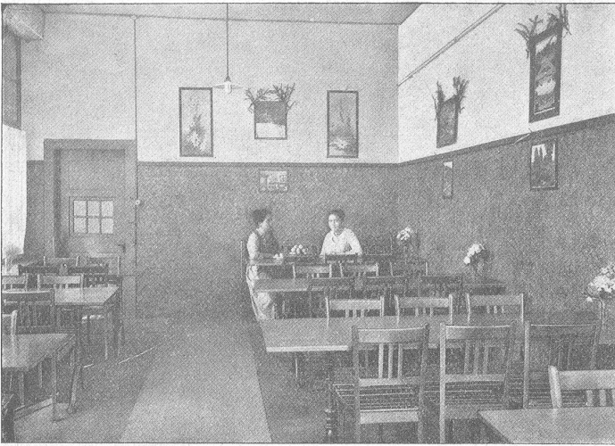
Arbeiterstube der Weberei Grünegg.

hat, ist darin vertreten. Andachtsvolle Stille herrscht im Saal, während der Engel den lagernden Hirten erscheint, die farbenprächtigen Könige vorbeiziehen und die bildhaft schöne Gruppe von Maria und Josef Auge und Ohr gefangen halten. Es ist, als ob Groß und Klein das Wunder von Bethlehem wirklich miterlebte.