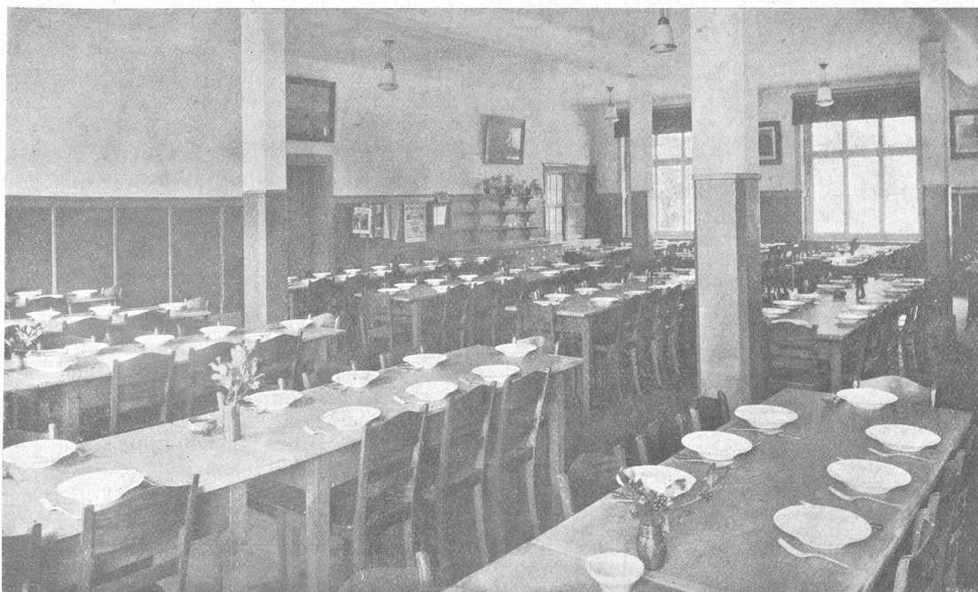
Wohlfahrtshaus „Schmelzhof“ Klus der L. von Roll'schen Eisenwerke Klus-Balsthal. — Eßsaal.