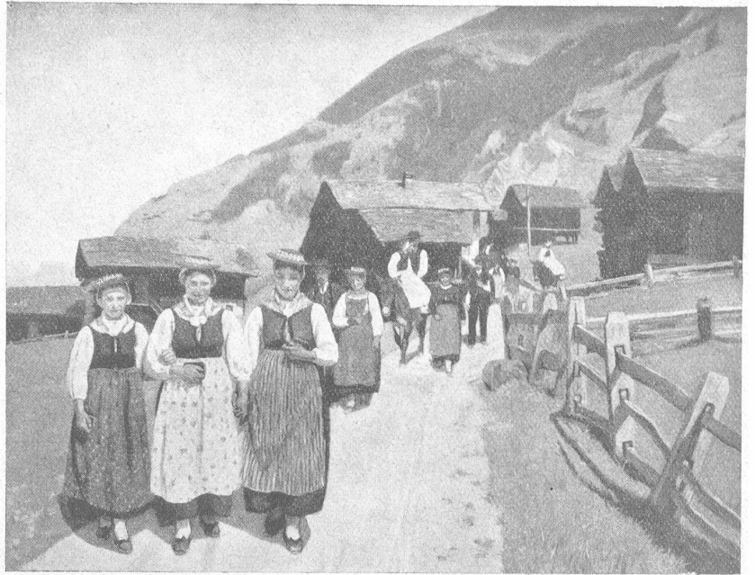
Nach der Messe im Val d'Anniviers. (Aus „Baub-Boby, Schweizer Bauernkunst“, Verlag Drell Gütli.)

Wie sie aus dem Walde kamen, hörten sie im Dörflein Schreien und Lamentieren, und als sie gegen das Pfarrhaus schritten, sahen sie davor einen gewaltigen Kreis von Leuten, besonders Weibern.