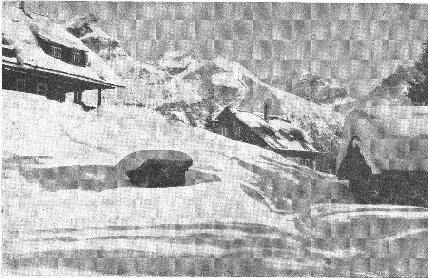
Gerföhnialp (1300 m) bei Engelberg, im Hintergrunde „Fähnen“ (2610 m).

Der zunächst Opfernde war ein hageres, giftig dreinschauendes Männchen. In der einen Hand hielt es den Rosenkranz, in der andern das Opfergeld: eine alte Schießmarke. Der machte auf das Kettchen zwei kugelförmige Neuglein, brennend wie reife Vogelbeeren. Mit flinkem Griff packte er das glänzende Ding und ließ es in sein rotblaues Regendach fallen. Das aber hatte ein Loch, und so fiel das Kettlein, von dem Bauer unbemerkt, auf den Steinplattenboden der Kirche. Ein nachrückendes Büblein legte es wieder in den Opfernaps, und da blieb es auch liegen zum heimlichen Aerger der erblustigen Verwandten des Pfarrers.