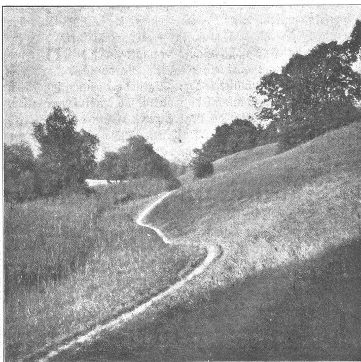
Abbild. 2. Uferweg-Partie zwischen Muri-Bad und Muri-Sähe.

Glücklicherweise also ist diese Gegend gerade den Bernern genug bekannt, als daß es nötig wäre, ihre Schönheiten mit ach! so unzulänglichen Worten schildern zu wollen. Auch die hier gezeigten Bilder vermöchten für sich allein nicht entfernt einen Begriff zu geben von den unerschöpflichen Reizen jener Landschaft. Denn sie ist vor allem auch als Ganzes schön, im Zusammenwirken von Nähe und Ferne, als lieblichstes Idyll im Rahmen der großen Linien der Aare und der Berge voll schönen Schwunges, im Reichtum und in der Frische einer urwüchsigsten, fast wilden Vegetation mit prachtvollen Durchblicken auf Fluß und Alpen — ein Zauber, dem mit der Kamera fast gar nicht beizukommen ist. Und wer ihn noch nicht gespürt hat, der möge nicht mehr zögern, diese Gefilde aufzusuchen. Jedem Naturfreund, der einmal ihre Reize kennen gelernt hat, bleiben diese Gegenden lieb und teuer. Seien es die wundervollen Schilfwiesen, die sich unterhalb des Märchlingengutes hinziehen, die in märchenhafter Verträumtheit ruhenden Seerosenteiche bei Allmendingen oder die prachtvoll ernsten, überraschend alpin anmutenden Ufer bei Rubigen, Riesen und