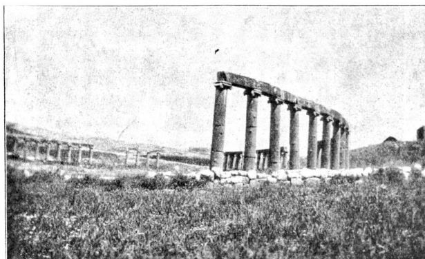
Gerafa (Djerasch) Forum.

tiefliegende, einst von Säulen umgebene Proscenium ist mit Schutt bedeckt und von Gras überwachsen. Nordöstlich vom zuerst erwähnten Tempel zieht sich durch die Stadt als Hauptverkehrsader, an der vermutlich (nach Burdhardt)