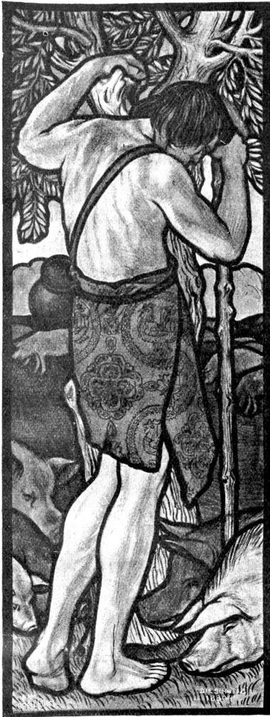
Das Gleichnis vom verlorenen Sohn.