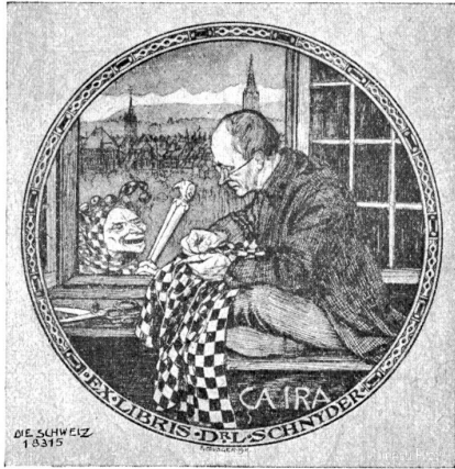
Exlibris Dr. E. Schwyzer, Arzt für Herzerkrankheiten in Bern.

Sein Werk ist heute noch eine hochachtenswerte Leistung ebenso wie sein Bild „Das Kunsthandwerk“ im Treppenhaus des Kornhauses resp. Gewerbemuseums. Schön ist die Ausmalung der Vernerstube der Zunft zu Mittel-Löwen. Feiner Humor und Beobachtungsgabe kamen zur Anwendung beim großen Fries „Die Stunden des Tages und der Nacht“ im Restaurant Zytglogge. Sein großer Fries im Audi-