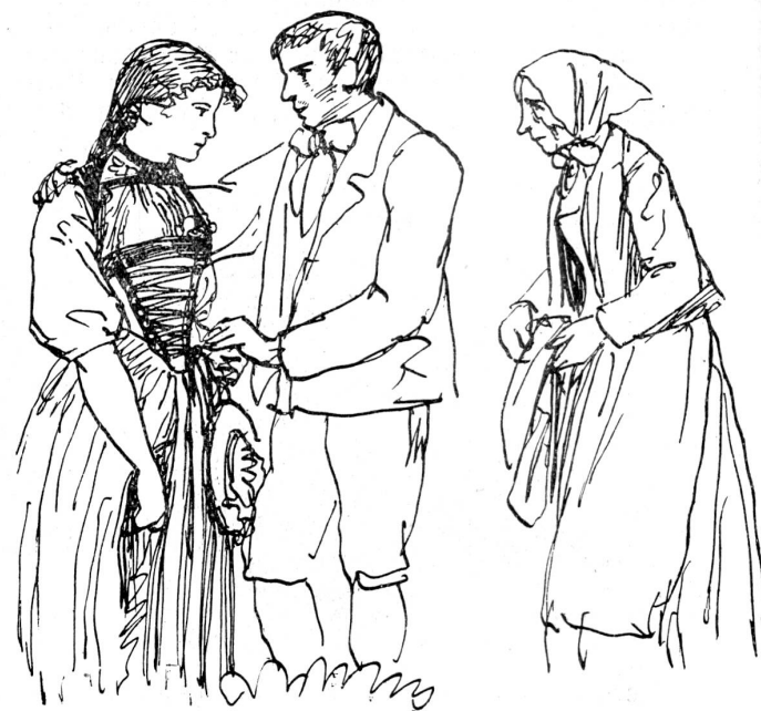
Annamarelli Resli Stini Figurinen zum Heimatschuh-Lustspiel „Geld und Geist“ von Simon Gfeller.

Lebensauffassung. — Ein kleines Erlebnis möchte ich hier noch erwähnen. Ich spielte einmal einen Bauernknecht und