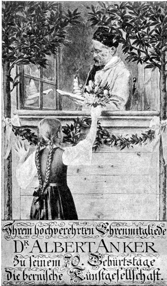
Ihrem hochverehrten Ehrenmitgliede DR. ALBERT ANKER zu seinem 70. Geburtstage Die bernische Kunstgesellschaft.

die Künstlerlaufbahn mußte dem praktisch-nüchtern denkenden Vater erst abgerungen werden. Als Lehrling besuchte er