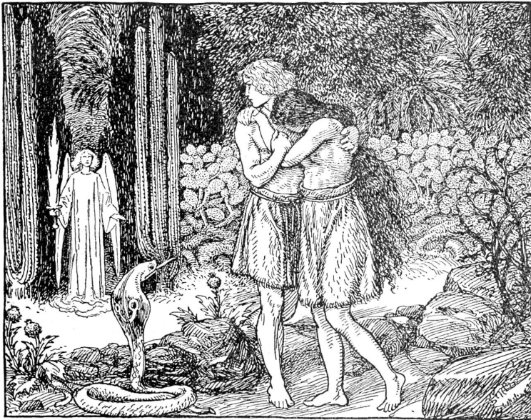
Die Vertreibung aus dem Paradies. (Bernische Kinderbibel, Staatl. Lehrmittelverlag.)