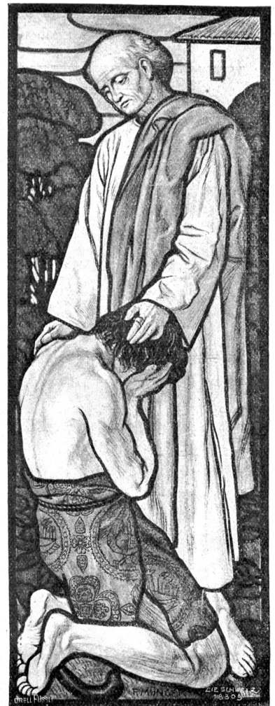
Zwei Kirchenfenster in Affoltern i/E.

Noch weiß ich ... Als ich deine Schwelle, Dein Haus, dein Heim einmal betrat, Hat sich in jener weiten Helle Dein reiches Schaffen mir genaht.