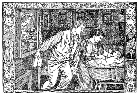
Schweizerisches Kirchengesangbuch. Titelvignette: „Cieder über Ehe und Familie“. (Verlag F. Reinhardt, Basel.)

Münger hat sich aber auch mit größern dekorativen Werken einen guten Namen im Schweizerlande gesichert. Er ist auch da seine eigenen Wege gegangen. Seine Aus- malung des Kornhauskellers war für jene Zeit eine Tat. Man denke sich einmal um 35 Jahre zurück und staune,