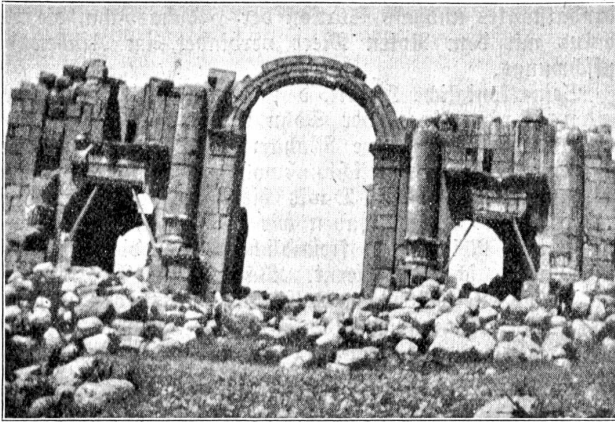
Gerasa (Jeraſch) Triumphthor.

wissen, als wir uns im nadelholzlosen Negypterland gar manches Mal nach den grünen „Blättern“ des Tannenbaumes gesehnt haben. Grüne Getreidefelder mit Delbäumen, Weiden mit schwarzen Beduinenzelten, zahlreiche Herden, pflügende und säende Eingeborene mit uralten Ader-