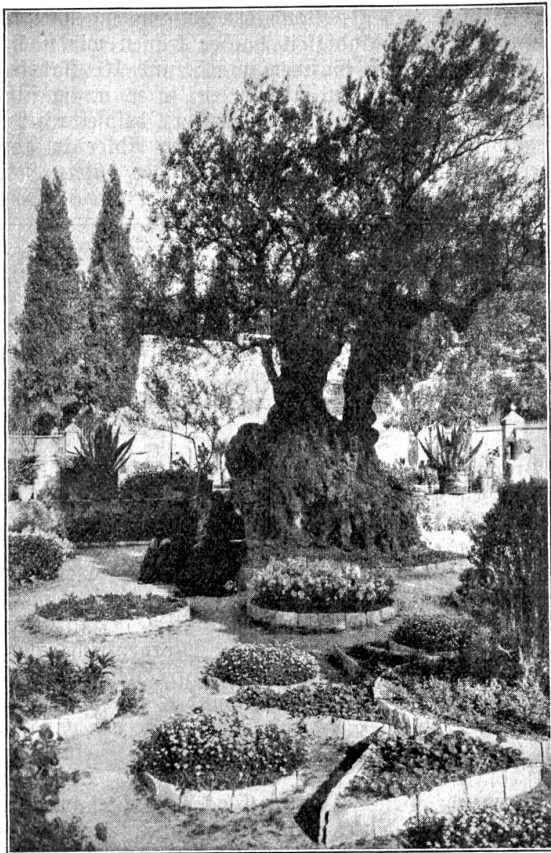
Der Garten Gethsemane, wo Jesus Christus in der Nacht vor seiner Gefangennahme ruhte.

Nachkommen der von Titus und Hadrian einige Jahre nach der Kreuzigung umgehauenen Bäume zu verehren, unter denen der Herr trauerte, sagte und „betäubt war bis in den Tod.“