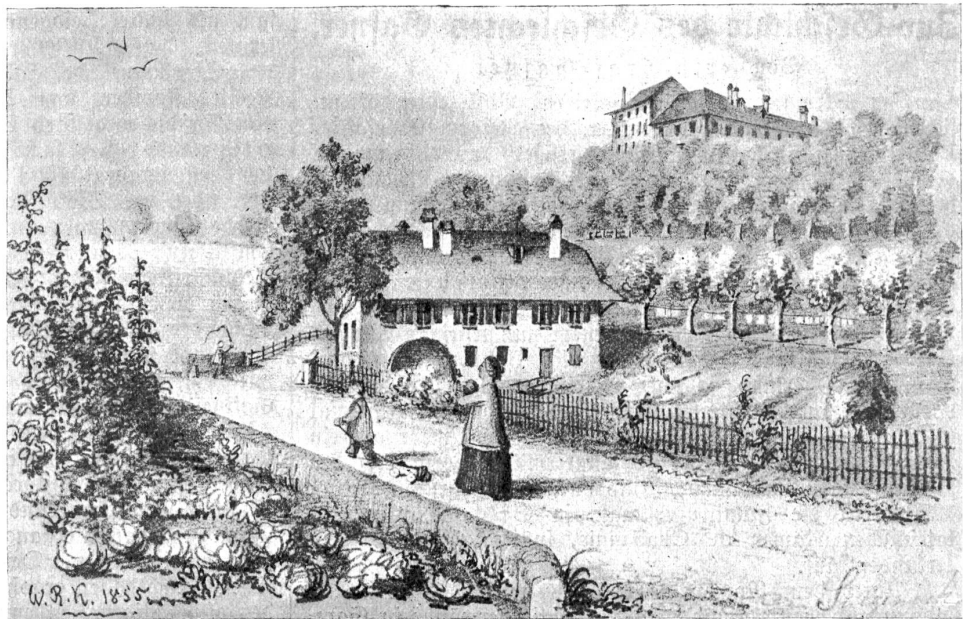
Das Häfnerhäuschen an der Sulgeneck, das erste Heim in Bern.

Die modernen hygienischen Forderungen bedingten schon vor dem Kriege neue Erweiterungen. Schon glaubte man 1914, an die Arbeit gehen zu dürfen. Da setzte der Weltkrieg einen dicken Strich unter das Projekt. Man litt und geduldete sich. Erst 1924 konnte mit Unterstützung von Bund und Kanton aus dem Fonds zur Förderung der Bautätigkeit an die baulichen Erweiterungen und Umbauten gedacht werden. Es wurden ein neues Lehrgebäude mit herrlichen Schul- und Sammlungsräumen, eine neue Turnhalle, ein Musiksaal erstellt, das alte Haus für das Zusammenleben der Seminaristen in der schulfreien Zeit umgebaut. Am 18. September