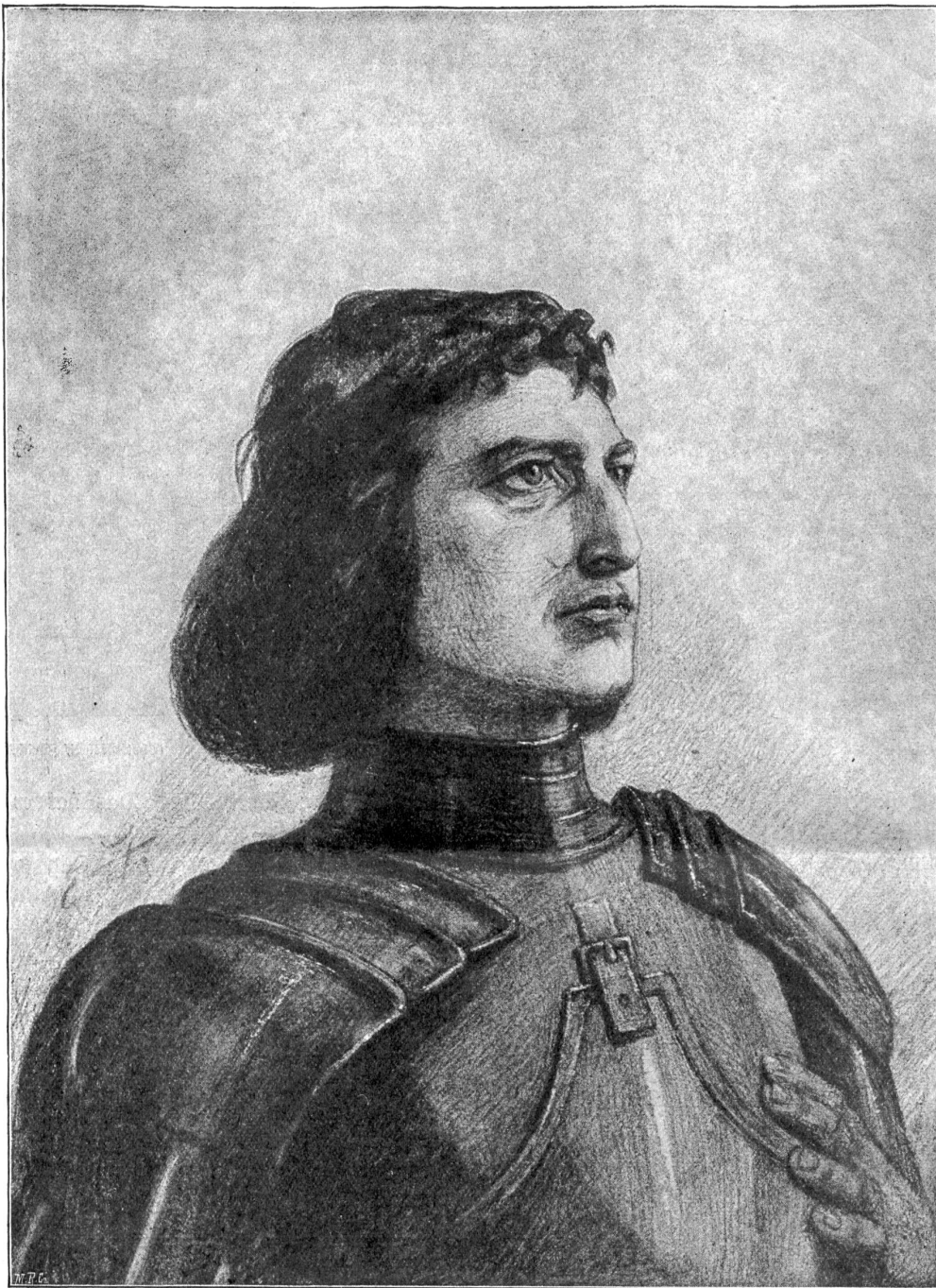
Adrian von Bubenberg. — Zum 450. Todestag.