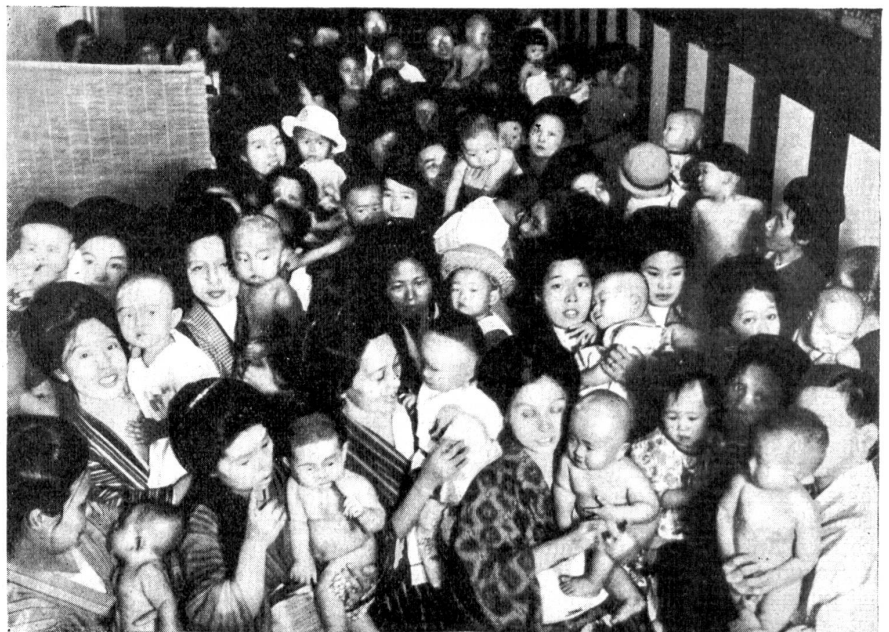
Säuglingsprüfung in „Osaka“ (Japan).